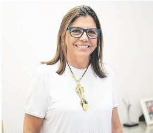
Roseana Sarney fala sobre a importância de O Estado ao longo de 42 anos de história no jornalismo maranhense.

“A internet e a rede social trouxe uma revolução na maneira de fazer o jornalismo. Hoje em dia, a imprensa tem um papel muito importante e vai continuar a ter um papel muito importante no futuro.”