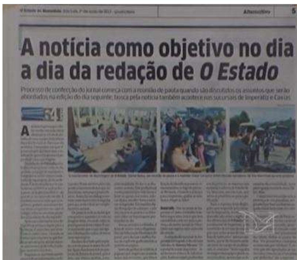
Figura 7: 54 anos de O Estado: A notícia e redação enfatizadas