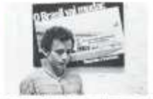
Representante do Estado em evento recente de comemoração pelo aniversário de 100 anos da publicação.

A última edição da revista O Estado do Maranhão poderá ser vista em uma grande variedade de pontos de venda em todo o Brasil. A publicação, que tem 100 mil exemplares, será distribuída em todo o país por meio de uma rede de distribuição que inclui lojas de conveniência, supermercados, livrarias e outras lojas de varejo. A distribuição será feita por meio de uma rede de distribuição que inclui lojas de conveniência, supermercados, livrarias e outras lojas de varejo.