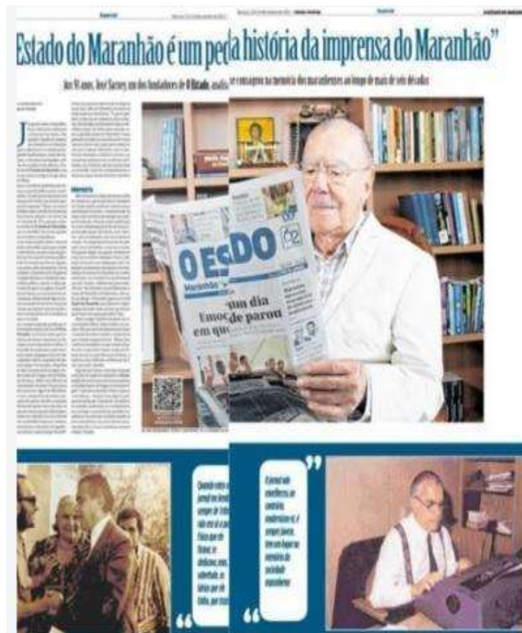
Figura 3: José Sarney na última edição impressa.