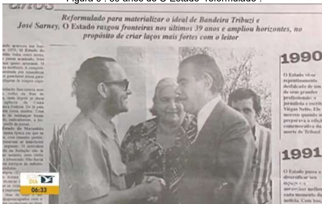
Figura 6 : 39 anos de O Estado “reformulado”.

Na imagem abaixo o especial de 39 anos do jornal, destaca-se as figuras de José Sarney e do poeta maranhense e primeiro diretor do jornal, Bandeira Tribuzzi.