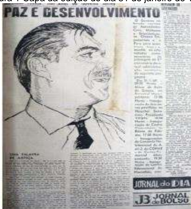
Figura 1 Capa da edição do dia 31 de janeiro de 1969.