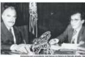
Representante do Estado em evento recente de comemoração pelo aniversário de 100 anos da publicação.

Além disso, a revista também será distribuída em pontos de venda em todo o Brasil. A publicação, que tem 100 mil exemplares, será distribuída em todo o país por meio de uma rede de distribuição que inclui lojas de conveniência, supermercados, livrarias e outras lojas de varejo. A distribuição será feita por meio de uma rede de distribuição que inclui lojas de conveniência, supermercados, livrarias e outras lojas de varejo.