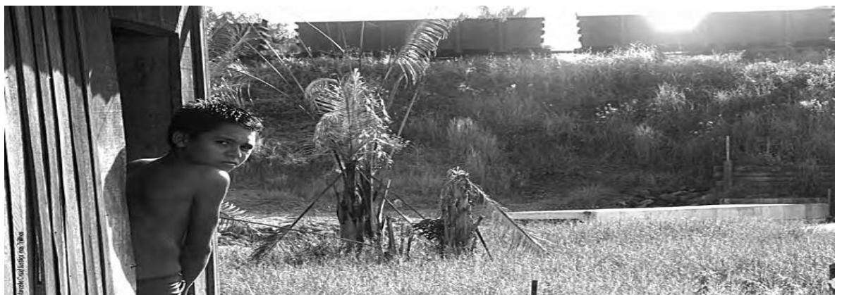
Imagem 2: contradições do desenvolvimento econômico da Vale

O tratamento que a empresa oferece às comunidades onde opera perfaz um caminho distinto do que ela divulga, pois o que mais se tem encontrado ao longo da Estrada de Ferro Carajás é pobreza, matéria de descaso tanto do Estado, quanto da empresa. Mas é o principal artifício de discurso que a Vale diz combater, como segue a imagem 2 abaixo.