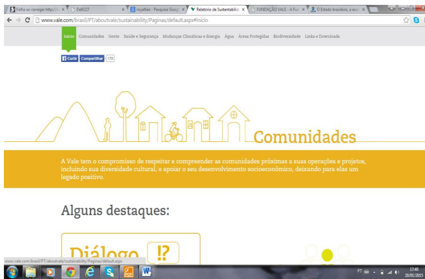
Figura 3 - sítio eletrônico da Vale

Uma das temáticas de responsabilidade social da Vale, retratada no seu Relatório de Sustentabilidade, bem como, no seu código de ética é a “comunidade” através do qual a empresa insiste em afirmar como ações “respeitar e compreender as comunidades próximas às nossas operações e projetos, incluindo sua diversidade cultural” (VALE, 2014a, p. 16). De acordo com a figura 3.