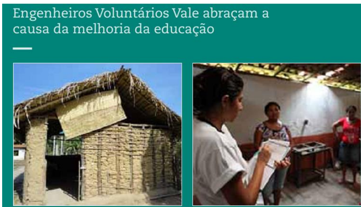
Imagem 4- Propaganda do voluntariado da Vale

com uma rede de mais de 3.400 empregados da mineradora, além de seus familiares e amigos (VALE, 2014).