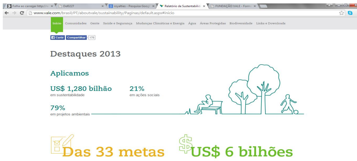
Figura 5: demonstrativo de investimentos sociais.

A Vale divulgou que obteve, em 2013, o equivalente a US$ 4,5 bilhões distribuídos entre seus acionistas e que os recursos aplicados na área socioambiental chegaram a aproximadamente US$ 1,3 bilhão, com quase 79% destinados a iniciativas ambientais e 21%, a ações sociais (VALE, 2014a), conforme a figura 5.