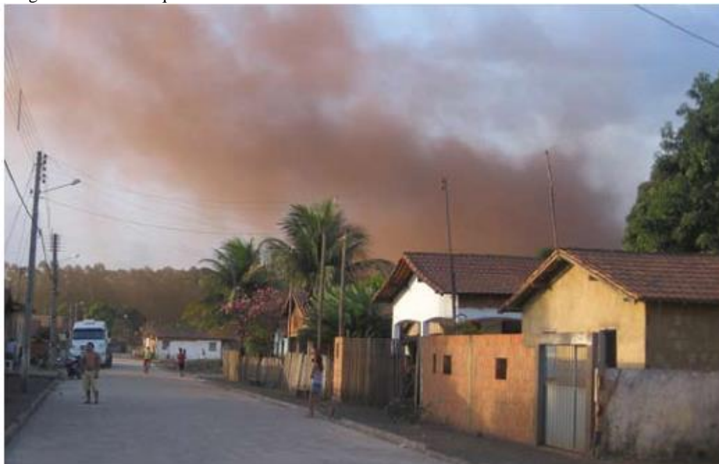
Imagem 1 - Bairro Piquiá de Baixo