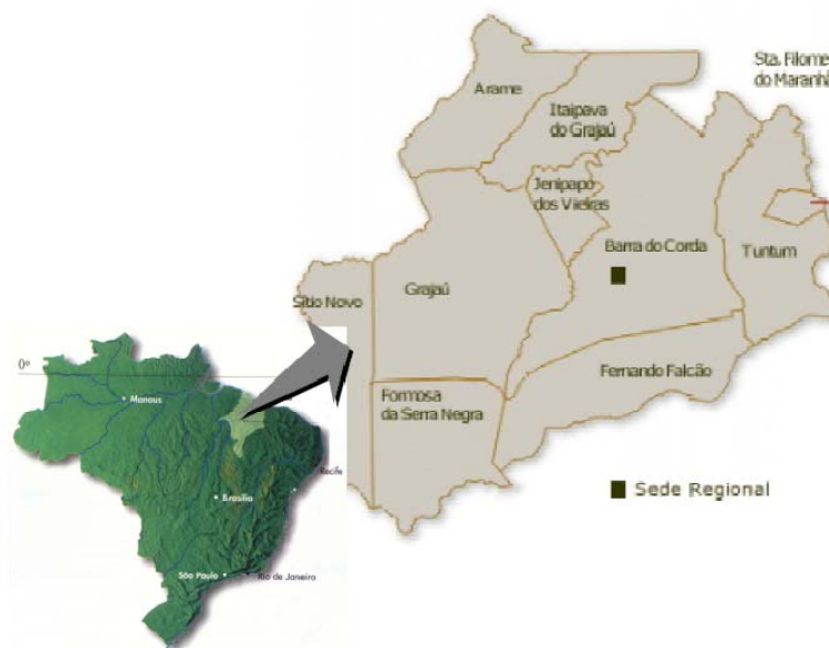
Figura 01: Mapa de localização do território canela