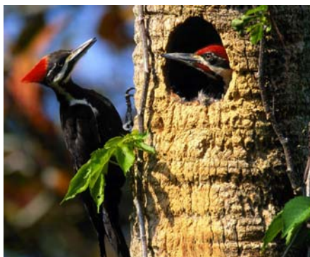
Foto 01- Imagem da ave popularmente conhecida por ‘pica-pau’ [ Campephilus robustus ]