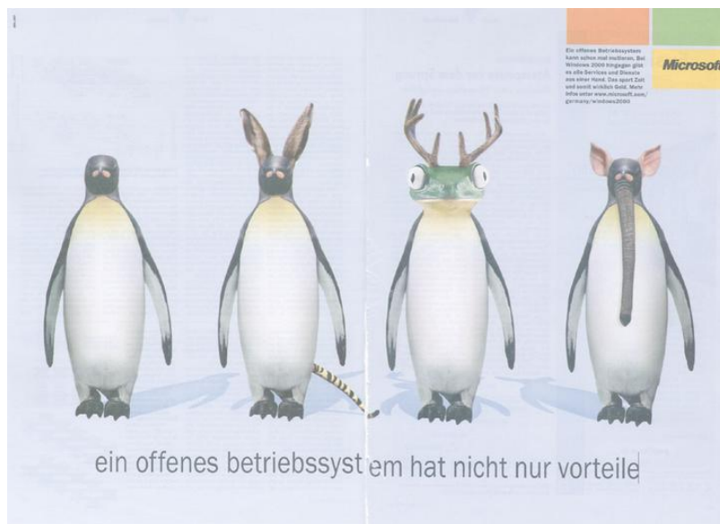
Figura 1: Campanha da Microsoft na Alemanha

software livre como perigoso, instável e sem valor para uso comercial. Na Alemanha, por exemplo, uma campanha da Microsoft retratava o mascote da Linux – um pinguim – sofrendo mutações, passando a ideia de não confiável, e uma frase que diz: “Um sistema aberto não tem só vantagens” – conforme mostra a figura a seguir: