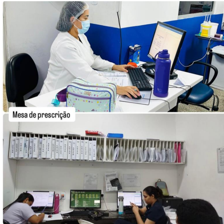
Figura 3 - Mesa de prescrição.