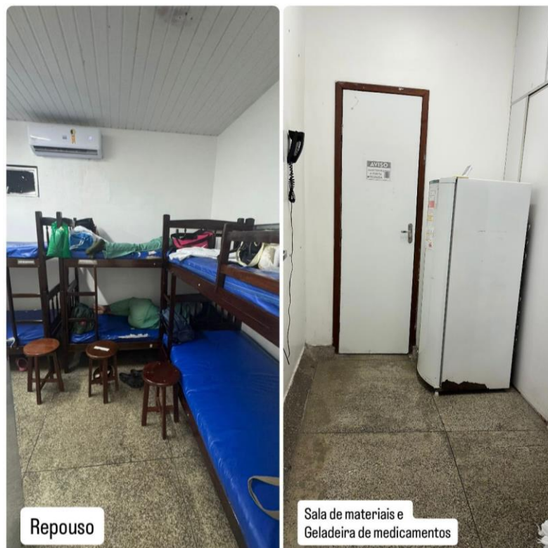
Figura 4 - Repouso, Sala de materiais e Geladeira de medicamentos.