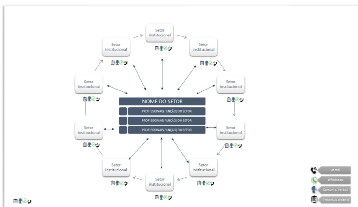
Figura 8 - Modelo de mapa da comunicação.

Para fins de replicabilidade do instrumento o modelo de mapa da comunicação (Figura 8) foi produzido para posteriormente ser aplicado aos demais setores do hospital e trazer para este estudo uma amostra mais significativa.