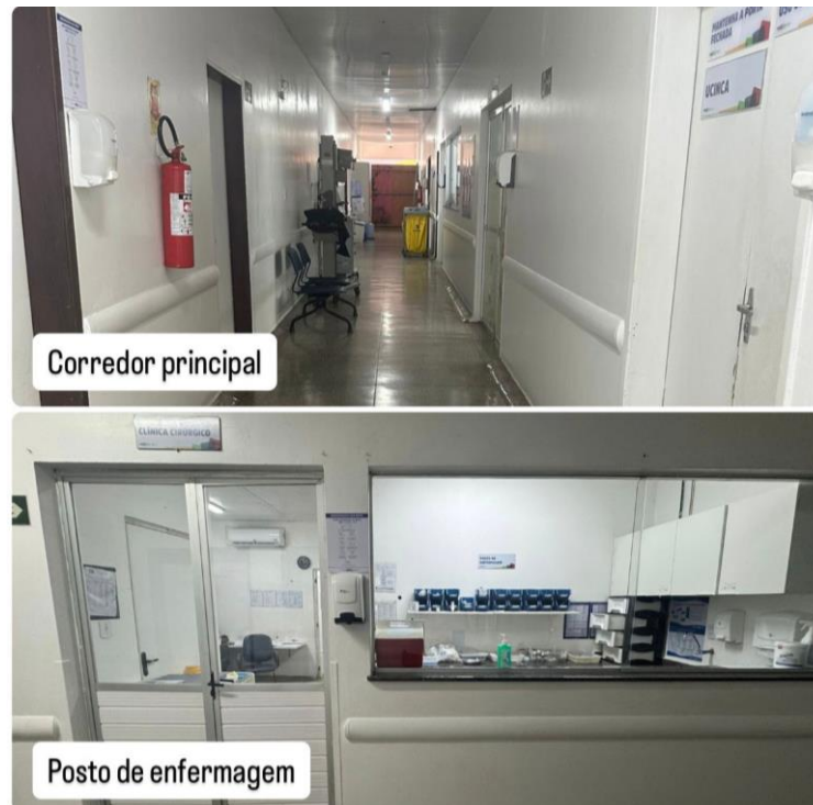
Figura 1 - Corredor Principal e Posto de Enfermagem.