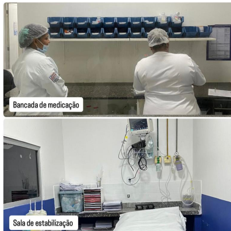
Figura 2 - Bancada de medicação e Sala de estabilização.