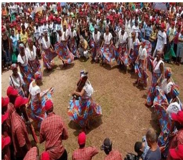
Figura 2- Tambor de Crioula - Dança