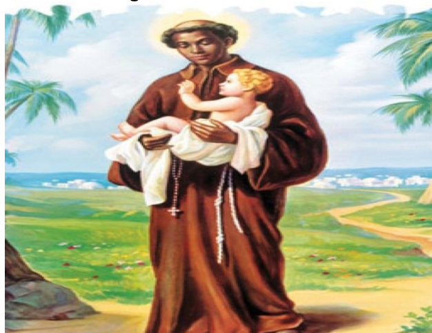
Figura 1 – São Benedito