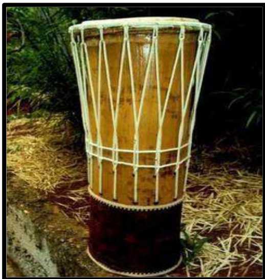
Figura 3 - Tambor