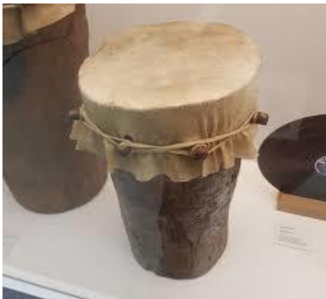
Figura 5 – Tambor Crioulinha ou Crivador