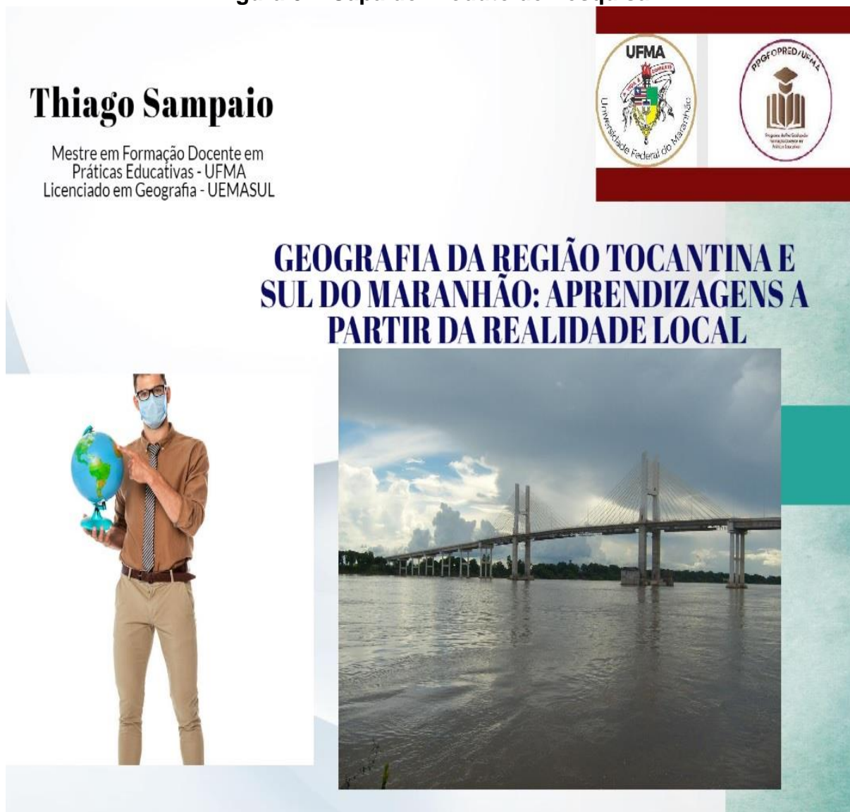
Figura 02: Capa do Produto de Pesquisa