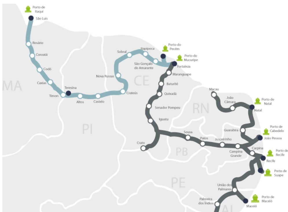
Figura 2 – Malha Ferroviária Nordeste

A linha férrea em operação conta com 1.237 quilômetros em bitola métrica, liga os portos de Itaqui (São Luís/ MA), Pecém (São Gonçalo do Amarante/ CE) e Mucuripe (Fortaleza/ CE), promovendo a integração e dinamizando a economia regional, a ferrovia movimenta cargas com 105 locomotivas e 1.377 vagões, em 2021, a empresa transportou 2,9 milhões de toneladas, dos quais 1,5 milhão de celulose, 621 mil de combustíveis e 322 mil de cimento ( CSN, 2022).