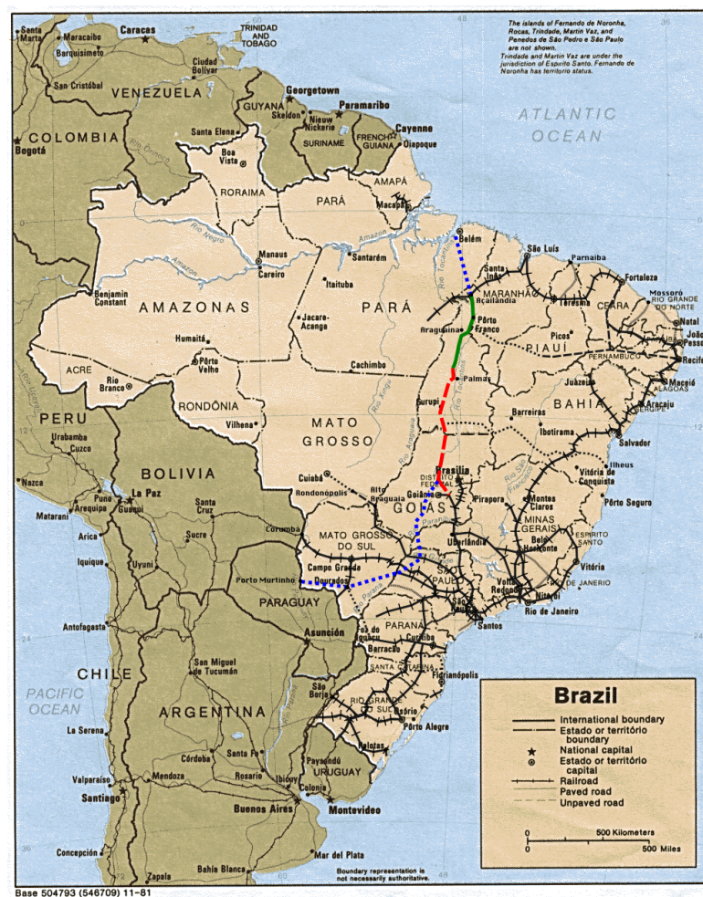
Figura 4 – Ferrovia Norte – Sul (trechos em atividade e a serem inaugurados)

A carga em grãos é colhida nesses municípios e transportada via ferrovia ao Porto do Itaqui, em São Luís-MA, com destino aos principais mercados mundiais consumidores. A ferrovia Norte-Sul, como o próprio nome revela, pretende integrar todo o território nacional em uma malha ferroviária, o projeto vislumbra a construção de 4.155 km atravessando todas as regiões nacionais, de norte a sul, conforme figura 4.