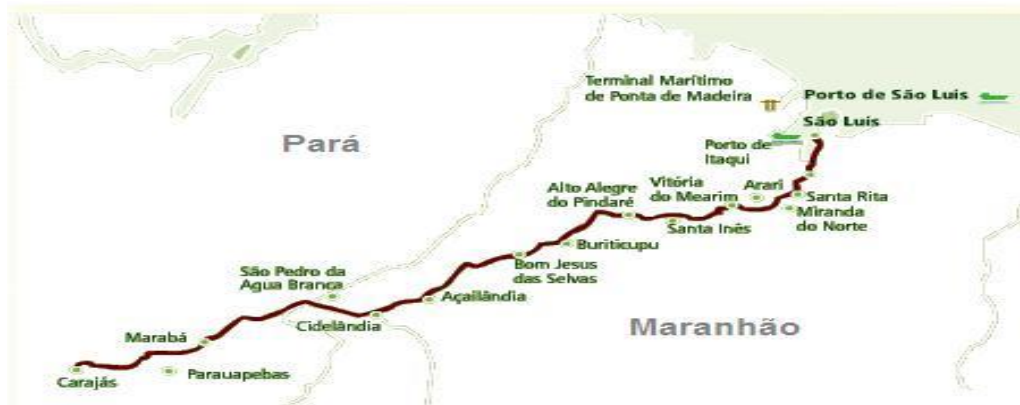
Figura 3 – Estrada de Ferro Carajás (EFC)