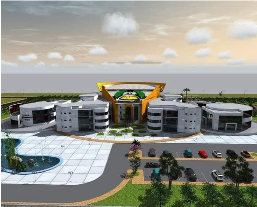
Figura 3 – Projeto do Palácio da Cultura

Todavia, apesar de falta de espaço, constatamos que foram realizados alguns projetos 11 , na qual está inserido o projeto de aquisição e legalização no terreno do Palácio da Cultura 12 , assim como sua construção, conforme demonstra figura abaixo.