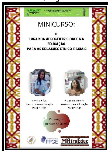
Figura 4 – banner minicurso “O lugar da Afrocentricidade na EREER”