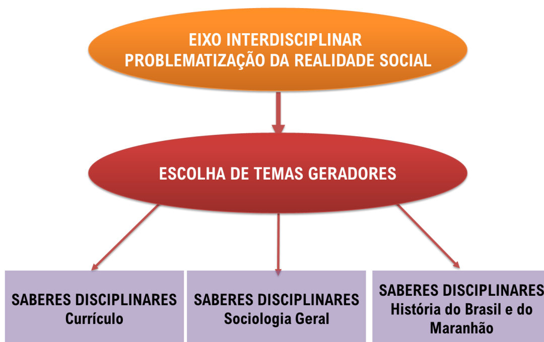
Figura 7 – Formação das Interdisciplinas Afrocentradas Intersubjetivas