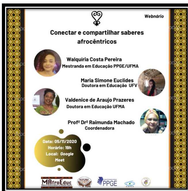
Figura 2 – banner webinário “Conectar e compartilhar saberes afrocêntricos”

2) Webinário dialogado – “Conectar e compartilhar saberes afrocêntricos”, (figura 2) ocorrido no dia 05 de novembro de 2020, na condição de apresentadora junto ao Grupo de pesquisa sobre Educação Afrocentrada (MAfroEduc Olùkó).