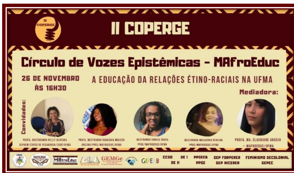
Figura 5 – banner círculo de vozes epistêmicas

5) Círculo de Vozes Epistêmicas - “A educação das Relações Étnico Raciais na UFMA”, (figura 5) ocorrido no dia 26 de novembro de 2021, na condição de palestrante no II Colóquio de Pesquisadoras/es das Epistemologias Étnico-Raciais de Gênero na Educação (II COPERGE).