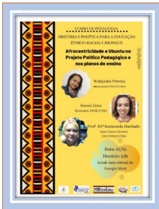
Figura 3 – banner webinário “Afrocentricidade e Ubuntu”

3) Webinário dialogado – “Afrocentricidade e Ubuntu no Projeto Político Pedagógico e nos planos de ensino”, (figura 3) ocorrido no dia 11 de dezembro de 2020, na condição de palestrante junto ao curso de Licenciatura em Pedagogia da UFMA.