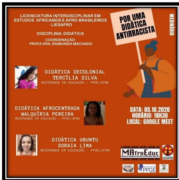
Figura 1 – banner webinário “Didática Antirracista”

palestrante junto ao Curso de Licenciatura Interdisciplinar em Estudos Africanos e Afro-Brasileiros – LIESAFRO.