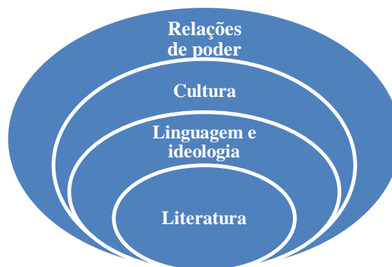
Figura 1 – Literatura e relações de poder

Nesse liame, a literatura, uma vez que se encontra no âmbito da linguagem, articula-se a significações atravessadas pelo seu contexto, assim como pelas ideologias e discursos que são construídos dentro da história de uma sociedade, com a finalidade de fomentar da imbricação com o sistema cultural vigente. É dessa forma que a cultura, como supracitado, por ser atravessada por relações hierárquicas faz com que exista a incidência de relações de poder a interseccionar também a linguagem e a literatura: