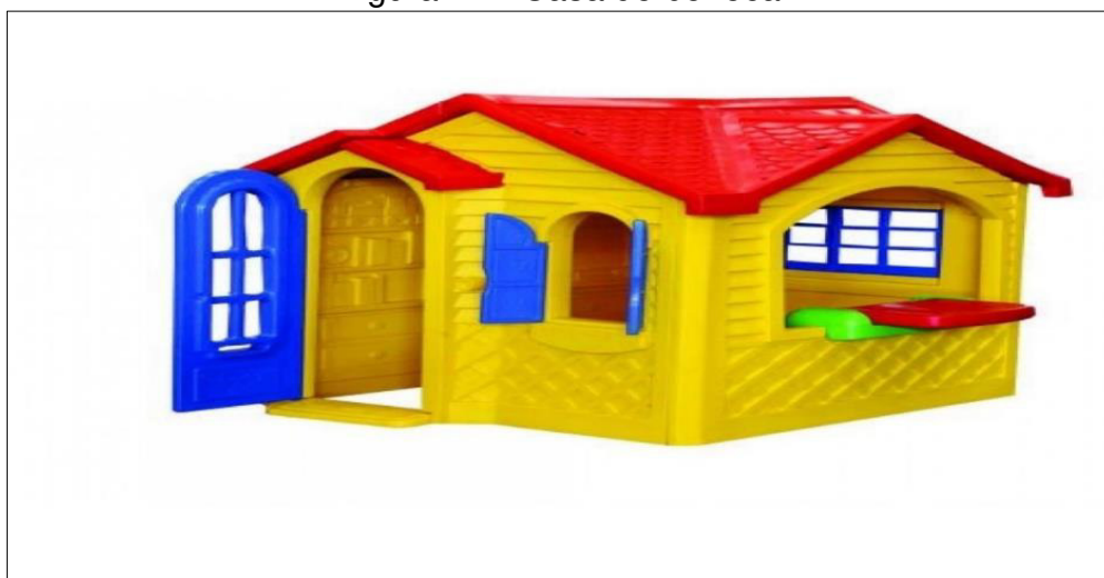
Figura 4 5 – Casa de boneca