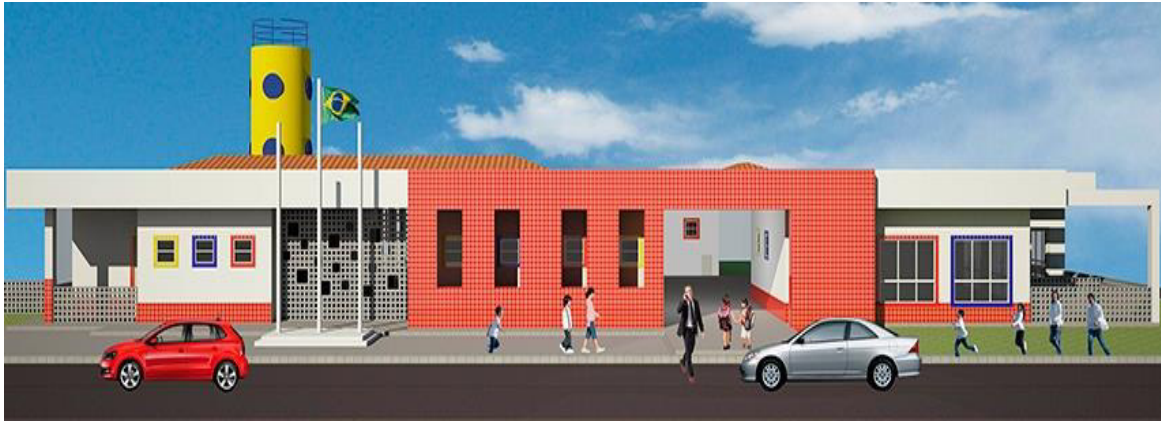
Figura 8 – Projeto tipo C

De acordo com esse padrão, o tipo B pode atender o número de até 240 crianças nos dois turnos e até 120 em horário integral; o terreno a ser construído é de 1.211,92 m 2 , tipo retangular com exigência de 40 X 70m de área.