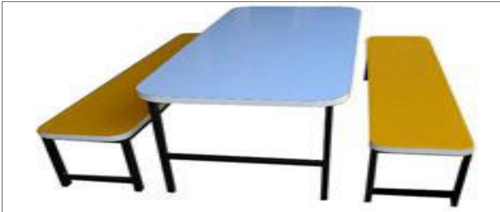
Figura 2 – Bancos do refeitório