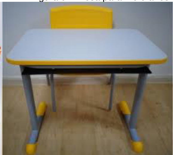
Figura 6 – Mesa para 4 e 5 anos