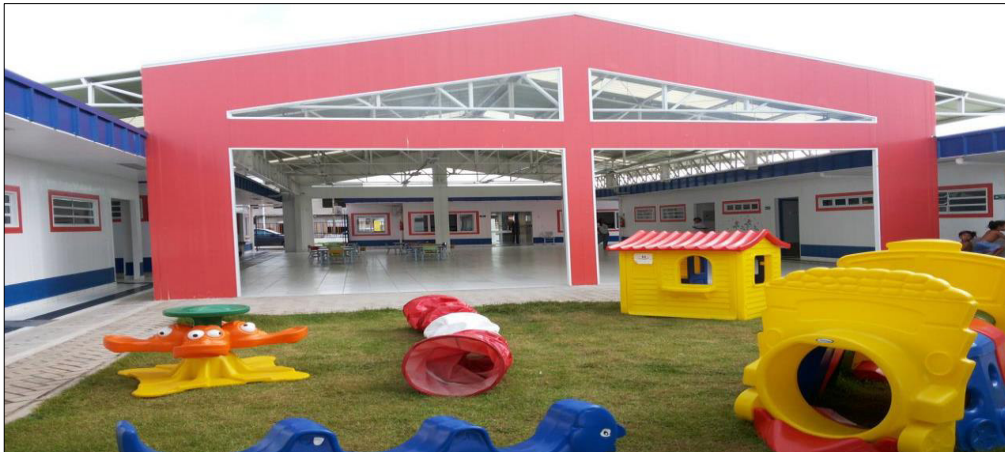
Figura 10 – Área externa do pátio de uma creche tipo B

A figura a seguir serve para demonstrar a área de um pátio (área externa) em creches do tipo B que seguem o padrão do Proinfância: