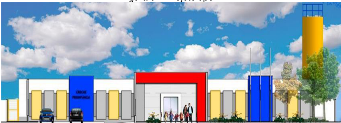
Figura 9 – Projeto tipo 1

O Projeto tipo C pode atender até 120 crianças nos dois turnos e 60 crianças no período integral, as exigências para construção são de no mínimo 35m X 45m de área.