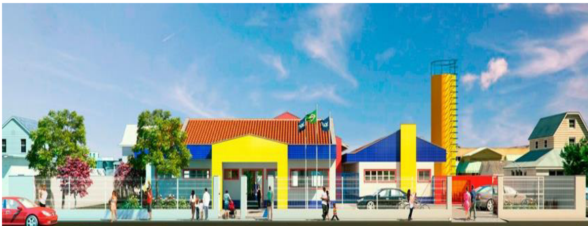
Figura 7 – Projeto tipo B

Observa-se que no tipo A o modelo fica a critério das prefeituras para apresentar projetos próprios; os demais, tipos B e C, 1, 2 e 3 seguem o padrão nacional, como podemos ver nas figuras 1 e 2. Anteriormente, na primeira elaboração eram três tipos de projeto A, B e C, em 2015 foram acrescentados os projetos tipo 1, 2 e 3, aumentando o número de oferta de vagas para o tipo 1 de 188 crianças no período integral e 376 crianças em dois turnos; no tipo 2 de 94 crianças em período integral e 188 em dois turnos; no tipo 3 de 188 crianças no período integral, preferencialmente em capitais e regiões metropolitanas.