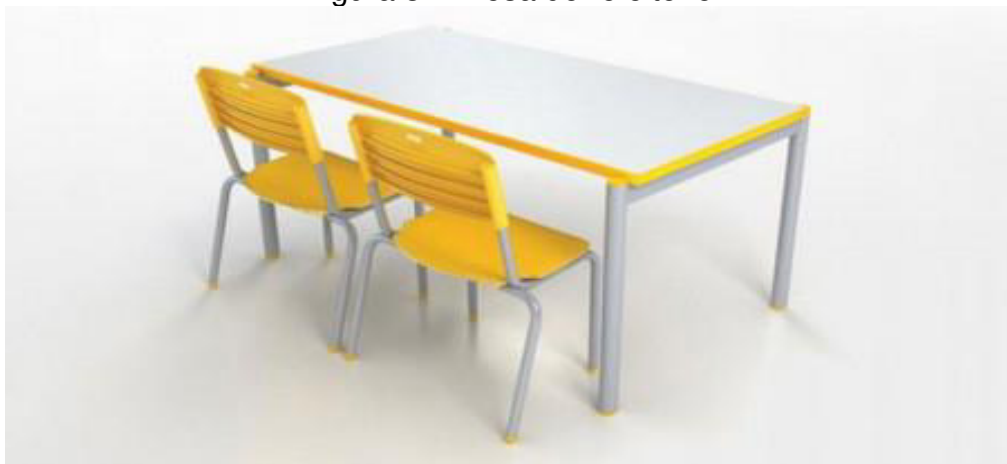
Figura 3 – Mesa do refeitório