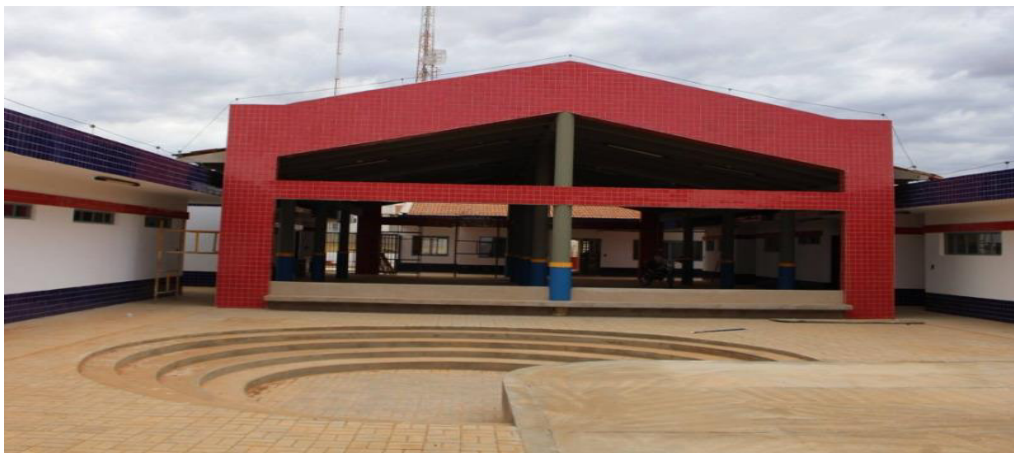
Figura 11 – Anfiteatro

O teatrinho a que a diretora se refere é o anfiteatro (foto abaixo) que na creche em estudo se afasta dos padrões definidos pelo Programa.