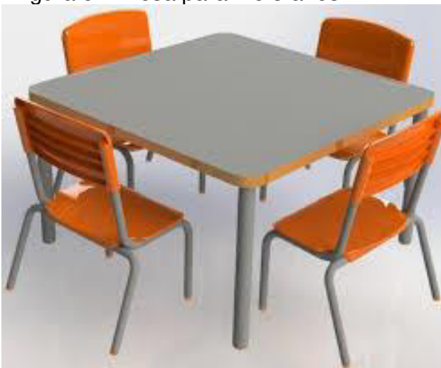
Figura 5 – Mesa para 2 e 3 anos

A seguir os dois modelos originais para o maternal I e II (2 e 3 anos) e Pré I e Pré II (4 e 5 anos).