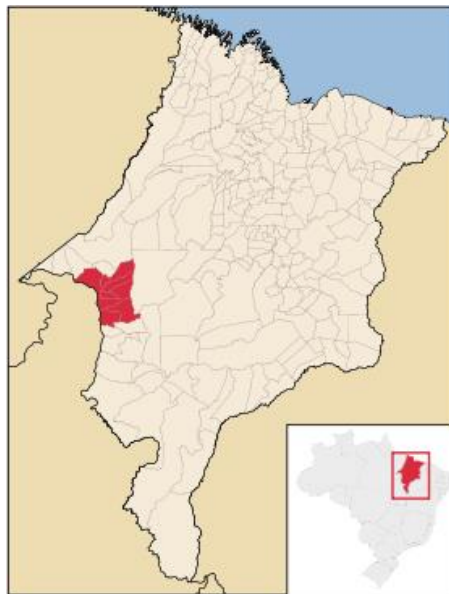
Figura 1 - Município de Imperatriz-MA

Iniciamos essa seção situando o município de Imperatriz, localizado no sudoeste do Estado do Maranhão, na microrregião nº 38. Tem limites com os municípios de Cidelândia, São Francisco do Brejão, João Lisboa, Davinópolis, Governador Edison Lobão e com o Estado do Tocantins. O município encontra-se a 629,5 quilômetros da capital do Estado. Suas coordenadas geográficas são 5° 31' 32' latitude sul; 47° 26' 35' longitude a W Gr., com altitude média de 92 metros acima do nível do mar.