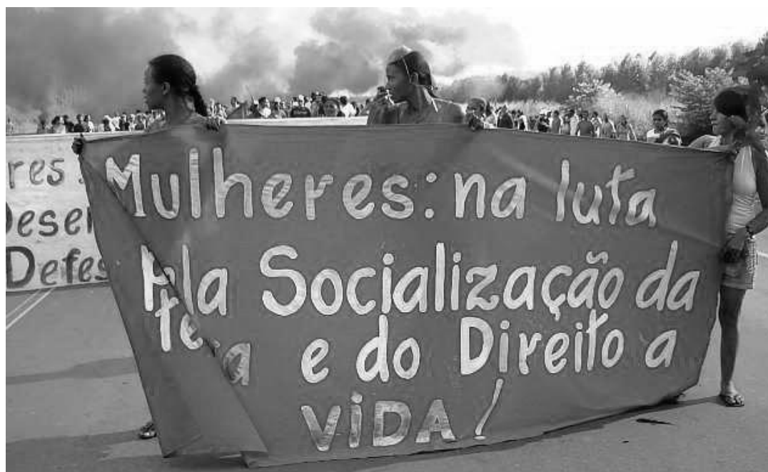
Fotografia 05: Ato Mulheres 8 de março 2008. Interdição da BR 010. Trecho Açailândia/Imperatriz -MA