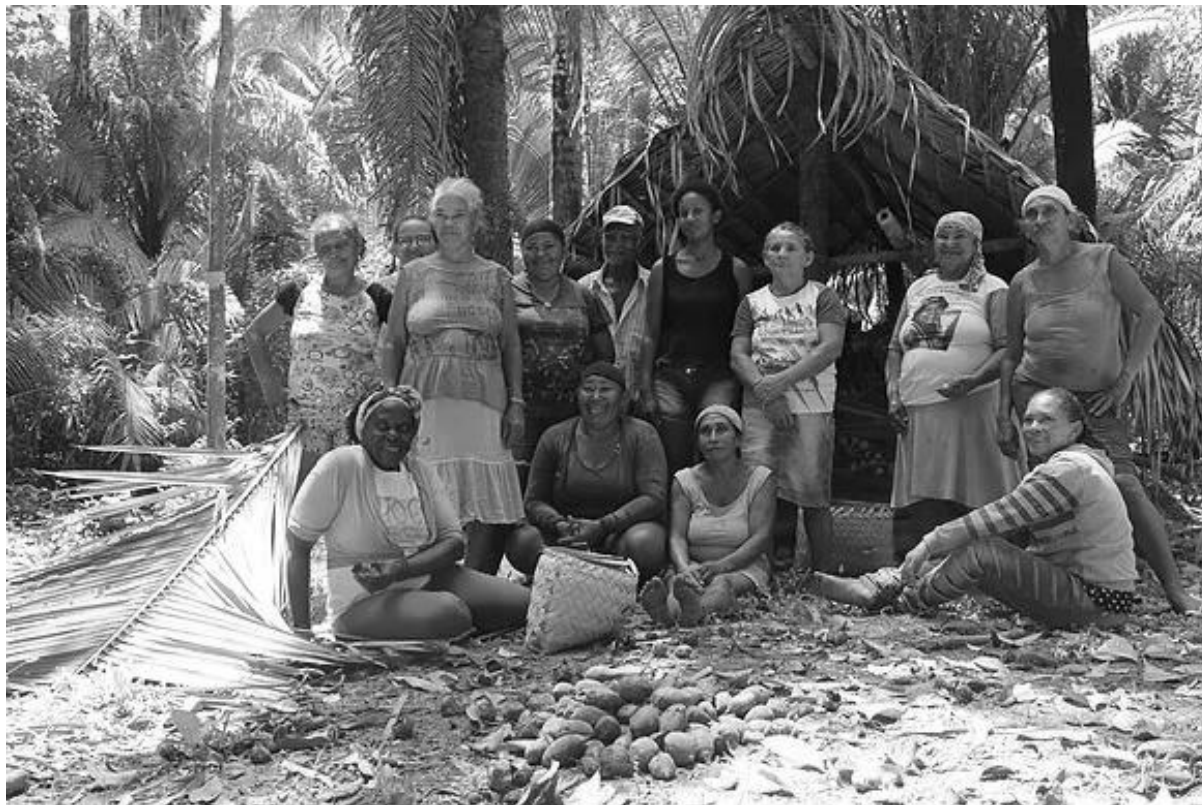
Fotografia 01: Mulheres Quebradeira de coco babaçu Cidelândia/MA