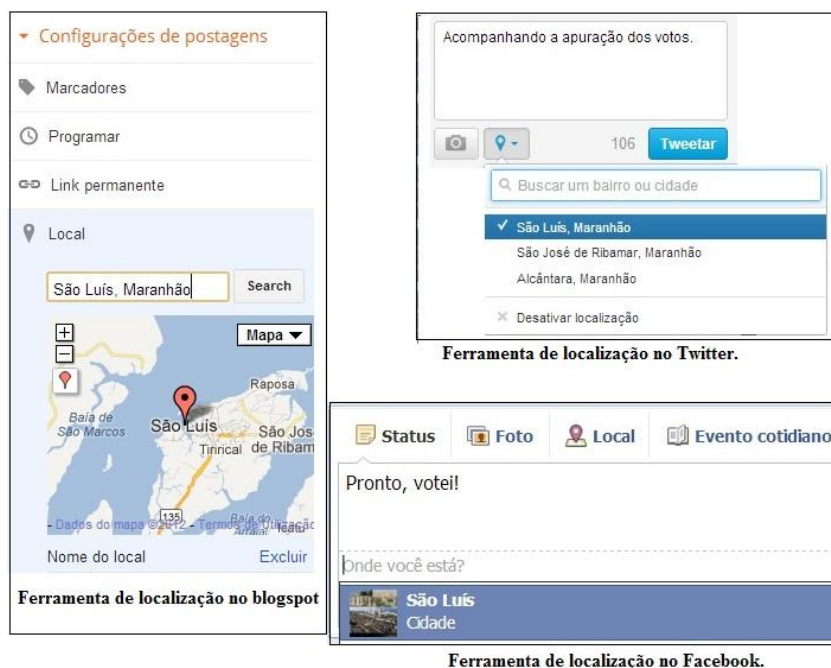
Figura 6. Exemplos de mecanismos de localização na Internet.

Atualmente, alguns sites e blogs dão a opção de o autor disponibilizar ao leitor sua localização. A rede social Facebook contém diversos aplicativos de geolocalização e o Twitter também possui dispositivo que permite ao sujeito acrescentar o local em que se encontra.