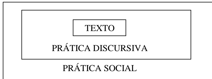
Figura 1. Modelo do discurso tridimensional de Fairclough

As práticas discursivas obedecem a ordens de discurso estabelecidas historicamente. No entanto, ocorrem rupturas com a ordem do discurso que partem de problematizações sobre as convenções discursivas, sobre o que está dito para os produtores e interlocutores do processo discursivo. O autor usa como exemplo a questão das relações de gênero, em que a sociedade moderna traz à tona problemáticas que passam a ser questionadas em suas posições hegemônicas. Mulheres foram tradicionalmente inseridas no papel doméstico. A evolução social e as crises econômicas fizeram com que a mulher reclamasse pelo direito ao trabalho fora de casa, pela valorização da sua mão de obra etc. A “mudança envolve formas de transgressão, o cruzamento de fronteiras, tais como a reunião de convenções existentes em novas combinações, ou a sua exploração em situações que geralmente as proíbem (FAIRCLOGH, 2001, p.127)”.