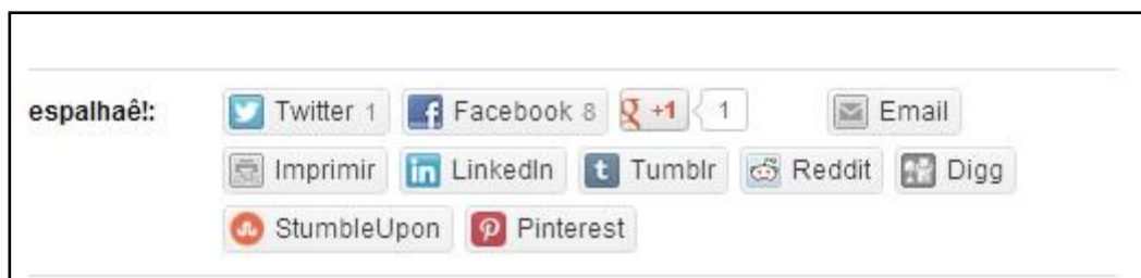
Figura 3. Rodapé com hiperlinks para redes sociais.

A conexão com outros espaços na web também fica visível no rodapé de cada publicação, em que ele disponibiliza botões de compartilhamento. Entres os botões, notam-se diversas opções de compartilhamento por impressão do texto, envio por e-mail ou por redes sociais. O número que aparece ao lado de cada botão indica quantas vezes a publicação foi compartilhada. Segundo ilustração na Figura 3, no Facebook , o texto foi compartilhado 8 vezes, já no Twitter e Google Plus , apenas 1.