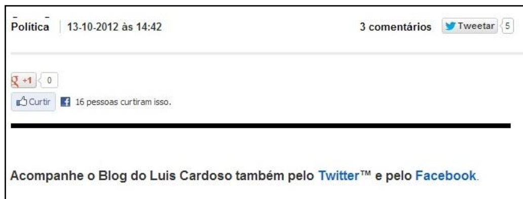
Figura 5. Hiperlinks no blog Luís Cardoso.

Nota-se que o blogueiro convida os leitores para seus perfis nas redes sociais de vários modos: em uma coluna do lado direito, através de gadgets e nas publicações. Abaixo do título, ele dispõe os ícones do Twitter , Facebook e Google Plus , além do botão para comentários e no rodapé da publicação, ele reforça o convite ao leitor para acompanhar o blog nas redes sociais. A figura abaixo mostra que em um texto sobre política do 13.10.2012, ele obteve 3 comentários, 5 tweets e 16 likes 37 .