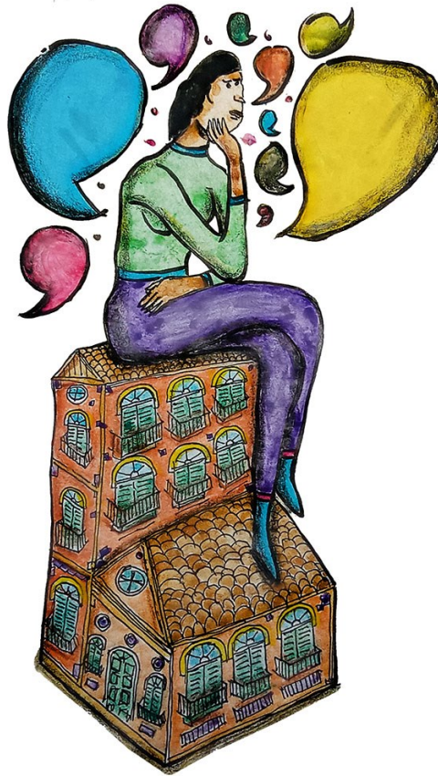
Figura 3 - Mulher Pensadora.