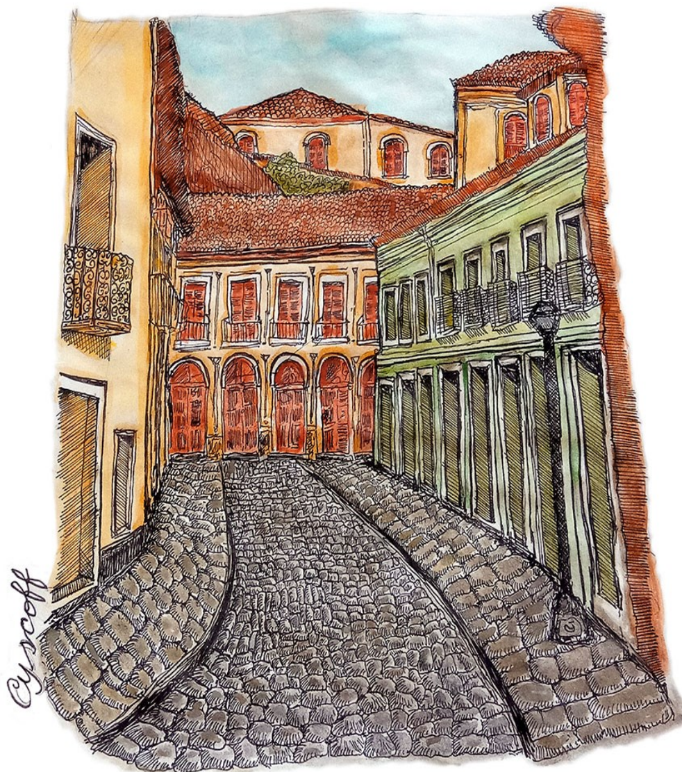
Figura 1 - Pensar na Eureka das Mulheres de Atenas.