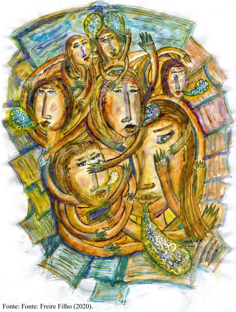
Figura 2 - A representação das Mulheres na Filosofia.