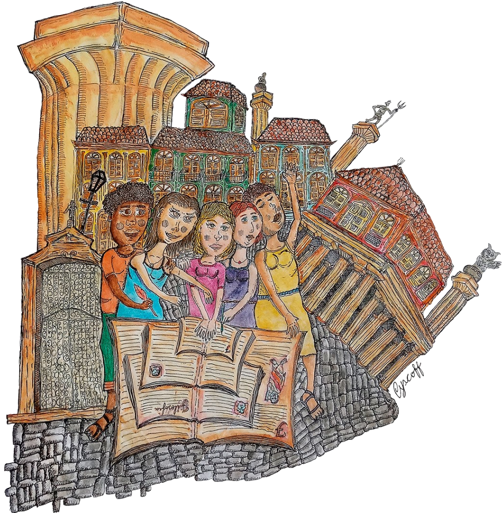
Figura 4 - Mulheres Atenas Maranhenses.