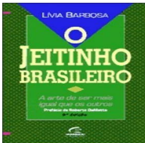
FIGURA 2 – Capa do livro Jeitinho Brasileiro, de Livia Barbosa.

Apresentação das regras e distribuição de cópias do livro O jeitinho brasileiro: a arte de ser mais igual que os outros , de Livia Barbosa.