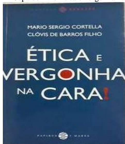
FIGURA 1 – Capa do livro Ética e vergonha na cara

O projeto Ler, Escrever e Pensar: conscientizar para transformar acontece anualmente e constitui-se de um projeto de incentivo aos alunos de ensino médio da rede pública estadual a produzirem textos dissertativo-argumentativos com base em algum livro de autor brasileiro que trate sobre questões gerais da nossa sociedade, visando incentivar a leitura e a escrita, causar reflexão, debate e possivelmente mudança de comportamento. O projeto se estende a todo ensino médio, porém, as produções analisadas nesse trabalho constituem apenas as produções dos alunos do 1ºano, pois só a estas foi garantido o acesso devido a função como professora se limitar a esta série de ensino. Como cada professor de Produção Textual responsável por cada série deveria acompanhar o desenvolvimento do projeto em cada etapa, não teria como se envolver com as produções das demais séries envolvidas.