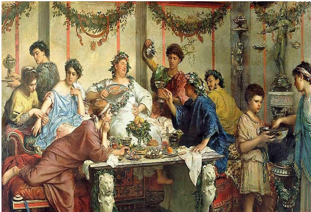
Figura 1: Banquete na Roma Antiga 11

Em um banquete (Figura 1), além de uma boa conversa e pessoas interessantes, busca-se o prazer, a diversão e o gosto pelos complementos da vida civilizada que envolvem poesia, música e leitura, cultivando a crença, proveniente da cultura grega, de que “os prazeres de alimentar o corpo não deviam separar-se dos prazeres mais elevados de alimentar o espírito” (STRONG, 2004, p. 36-37).