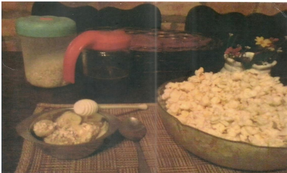
Figura 12: Fotografia do Jantar

Assim como no almoço, a fotografia do jantar, (Figura 12), contou com uma refeição simples, porém, diferente de muitos alimentos consumidos à noite. A tigela com pipocas foi acompanhada de uma porção de rodela de banana, encobertas com