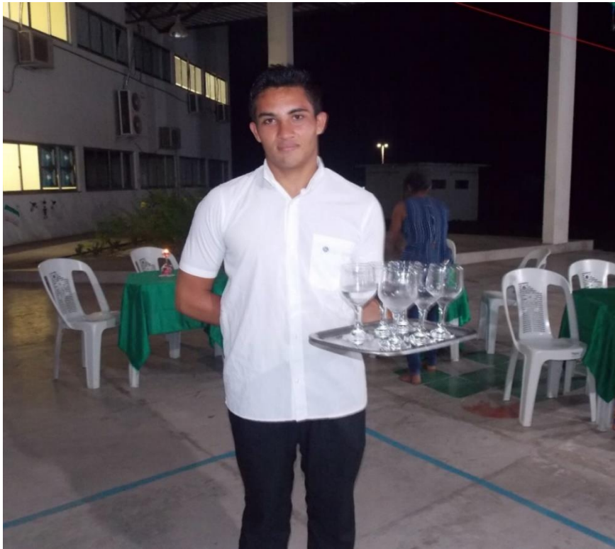
Figura 20: Aluno caracterizado de garçom

A próxima descrição ressaltou a importância do banquete para o bom relacionamento entre os alunos e para a aprendizagem de novas culturas e costumes alimentares.