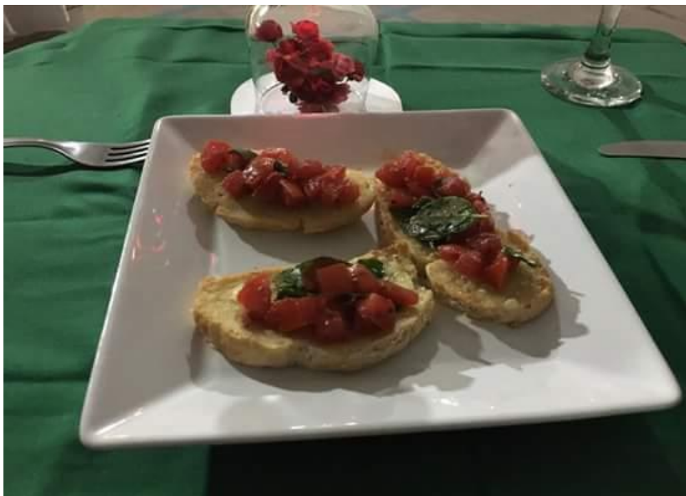
Figura 17: Bruschettas (Entrada)

Depois de um breve período ao som de música italiana instrumental, duas alunas iniciaram as apresentações artísticas recitando poesias que enalteciam o amor, criando encanto e expectativas nos participantes, enquanto que na cozinha, montavam-se as entradas ( Bruschettas ).