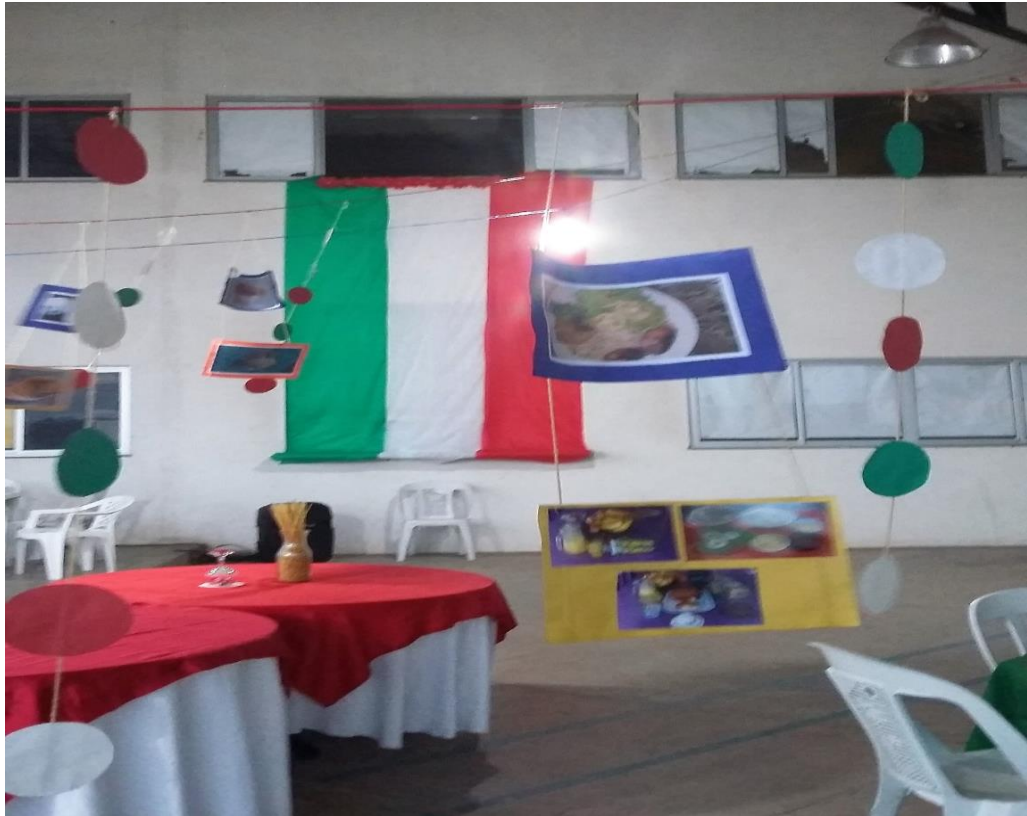
Figura 8: Cenário do Banquete “Romeu e Julieta”

Os círculos coloridos 19 foram confeccionados em cartolinas e coladas em barbantes. As fotografias realizadas em atividade extraclasse foram executadas com o auxílio de mídia eletrônica (telefone celular), e, posteriormente, reveladas e expostas no banquete .