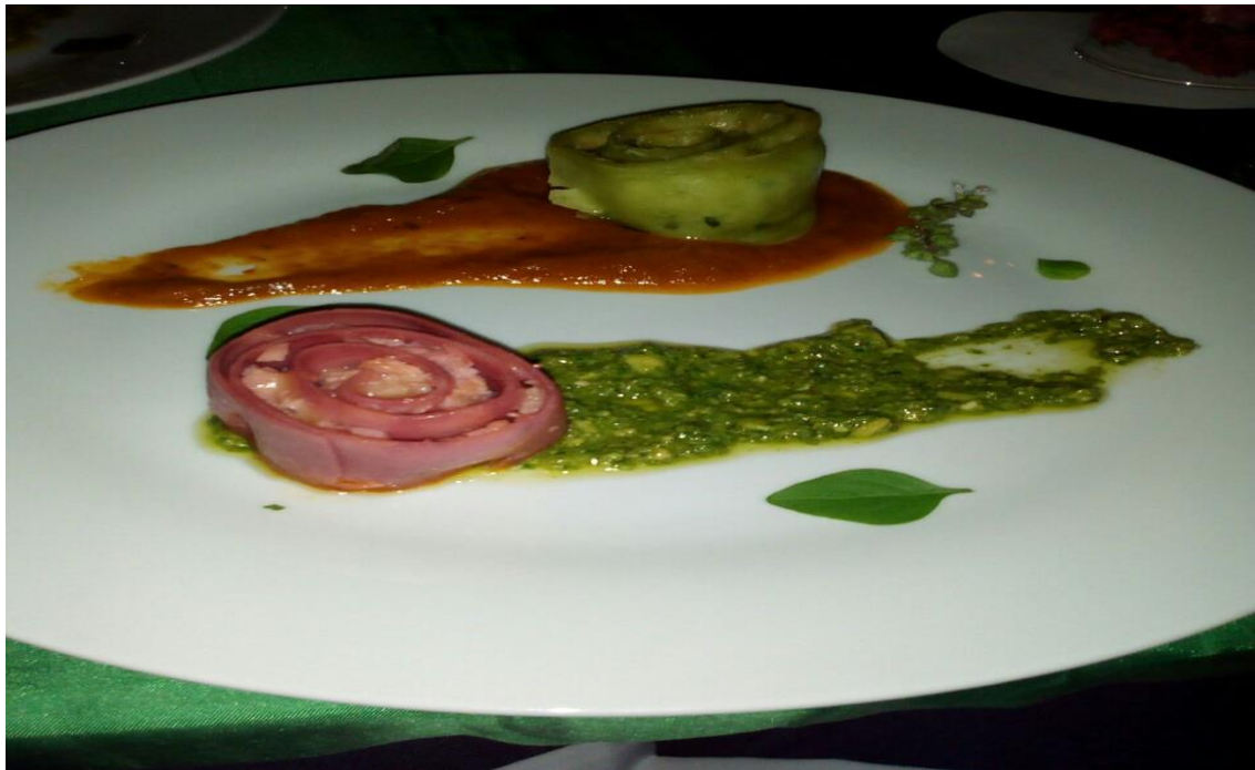
Figura 18 – Rondelli (Prato Principal)

Ao término da peça, o prato principal ( Rondelli ) (Figura 18) foi servido, causando enorme surpresa nos convidados pela aparência do alimento, apresentado nas cores da bandeira italiana. Essa etapa do banquete foi acompanhada por músicas italianas, tocadas ao vivo por um aluno, com a assistência de uma flauta.