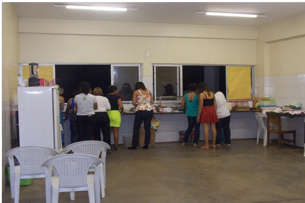
Figura 16: Montagem das Bruscchettas e Rondelli Fonte: Arquivo Pessoal do Aluno A.S.F. (2017)

Assim, com o cardápio preparado e já em vias de ser servido no Banquete “Romeu e Julieta”, foram instalados e testados os equipamentos como caixa de som e notebook, no qual foram disponibilizadas as músicas transmitidas via bluetooth pelo celular. As músicas italianas instrumentais, interpretadas por André Rieu 25 e Luciano Pavarotti 26 , foram reproduzidas por mídia eletrônica; as demais foram apresentadas ao vivo, com o auxílio de um violão e de uma flauta.