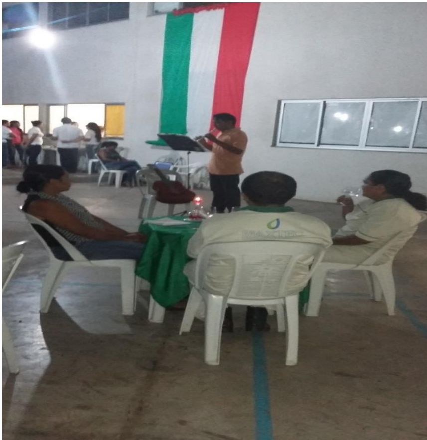
Figura 4: Aluno apresentando músicas italianas com auxílio da flauta

Não há registros fotográficos dos alunos no momento da encenação do fragmento da peça Romeu e Julieta. A imagem visualizada, adiante, corresponde ao mesmo aluno que interpretou Romeu, tocando músicas italianas, com a flauta, após a referida peça.