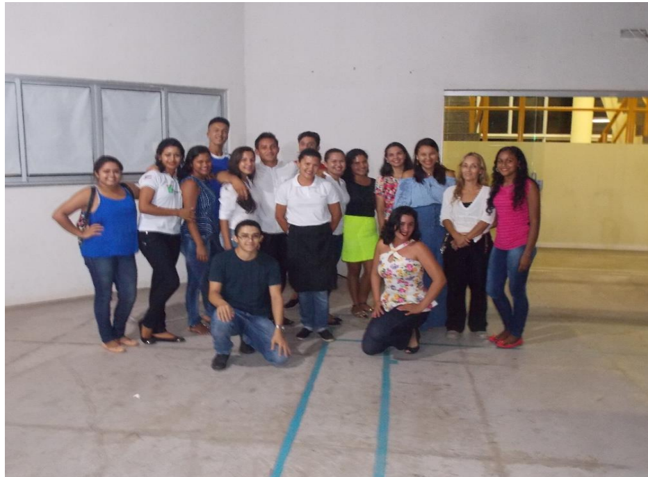
Figura 21: Alunos e Docente responsáveis pelo Banquete “Romeu e Julieta”

Percebeu-se que a aplicação de forças conjuntas alcançou o fim determinado, resultando em um trabalho rico de percepções e sensações, causando uma boa impressão nos convidados que apreciaram essa prática pedagógica. Abaixo, a imagem dos alunos e da docente, responsáveis pela realização do Banquete “Romeu e Julieta” (Figura 21).