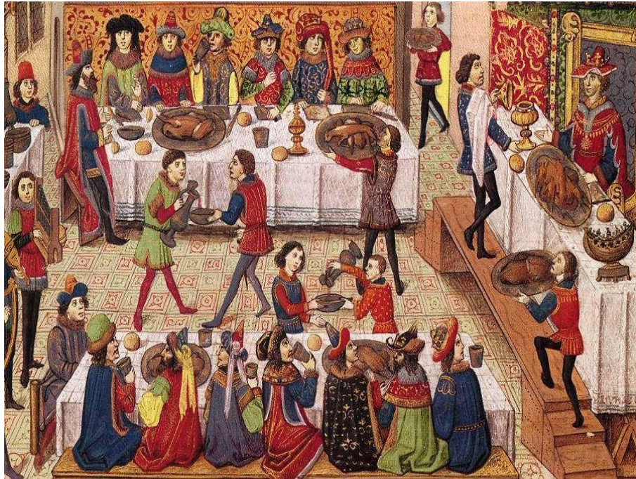
Figura 2: Festim medieval na corte do Duque de Borgonha Fonte: Dufaur (2012) 14

Relaciona-se à necessidade humana de construir significados que estruturam sua vida terrena, por meio da arte teatral e da culinária, buscando um sentido para a vida, por meio de um mundo simbólico coerente, num contínuo jogo dialético entre o sentir, o pensar e o fazer.