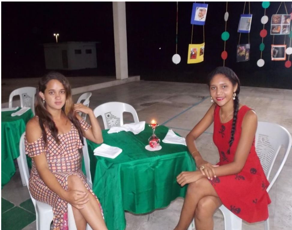
Figura 5: Personagem Ama, da peça Romeu e Julieta (à direita)

Na Figura 5, a aluna da esquerda, encontrava-se em estado avançado de gravidez e foi poupada dos serviços preparatórios do banquete , tendo como função, apreciar, como convidada, o trabalho dos colegas, e relatar, posteriormente, suas impressões. À direita, encontra-se a aluna que fez a personagem Ama, com um vestido vermelho enfeitado com detalhes pretos e cabelos arrumados, em forma de trança, em uma das mesas do evento.