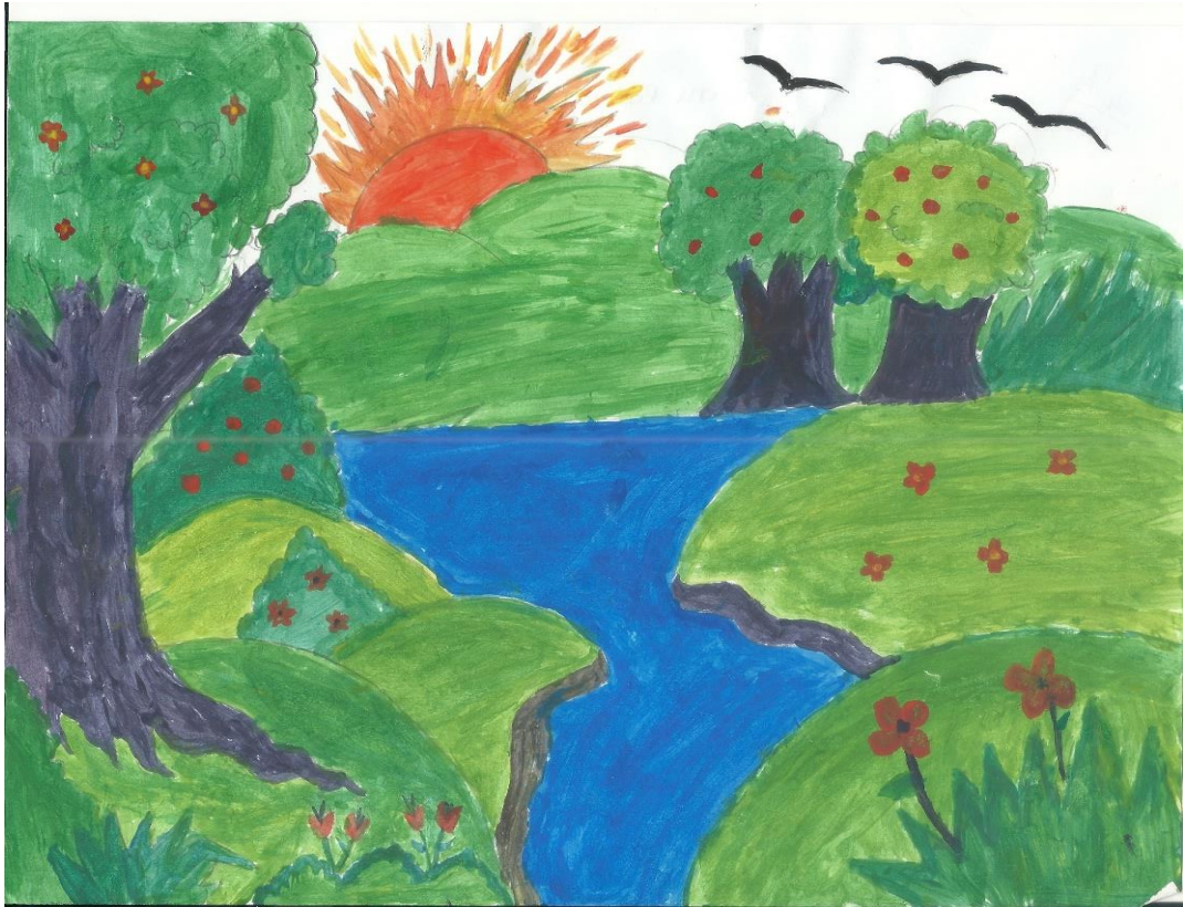
Figura 14: Desenho de Memória

Os relatos, a seguir, demonstraram o quanto essa prática foi prazerosa. Os alunos escreveram “[...] foi bem dinâmico, divertido. Lembrei da minha infância. Rsr...” (O.S.S); “A análise dos objetos como suporte para os desenhos foi sublime, pois exercitamos a criatividade a estimulação do cérebro” (S.M.S) e “Foi uma das melhores aulas que tivemos em sala; divertida e com muita criatividade envolvida” (A.S.S). Revelaram a diversão e criatividade envolvidas, favorecendo a percepção das cores, importante para a Arte e a Gastronomia.