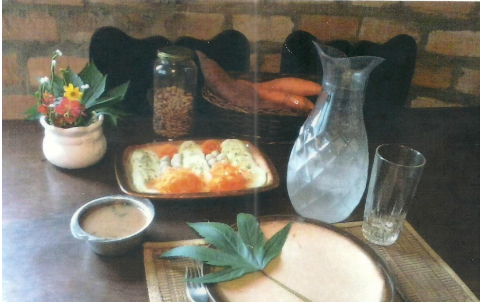
Figura 11: Fotografia do Almoço

feijão cozido, tendo como toque final, uma folha de vinagreira disposta na lateral esquerda do prato.