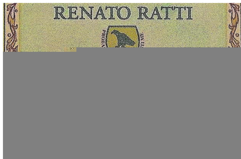
Figura 15: Rótulo do vinho típico de La Morra

O suco de uva foi envasado em garrafas de vidro com o rótulo de um vinho típico da cidade de La Morra , na Itália (Figura15).