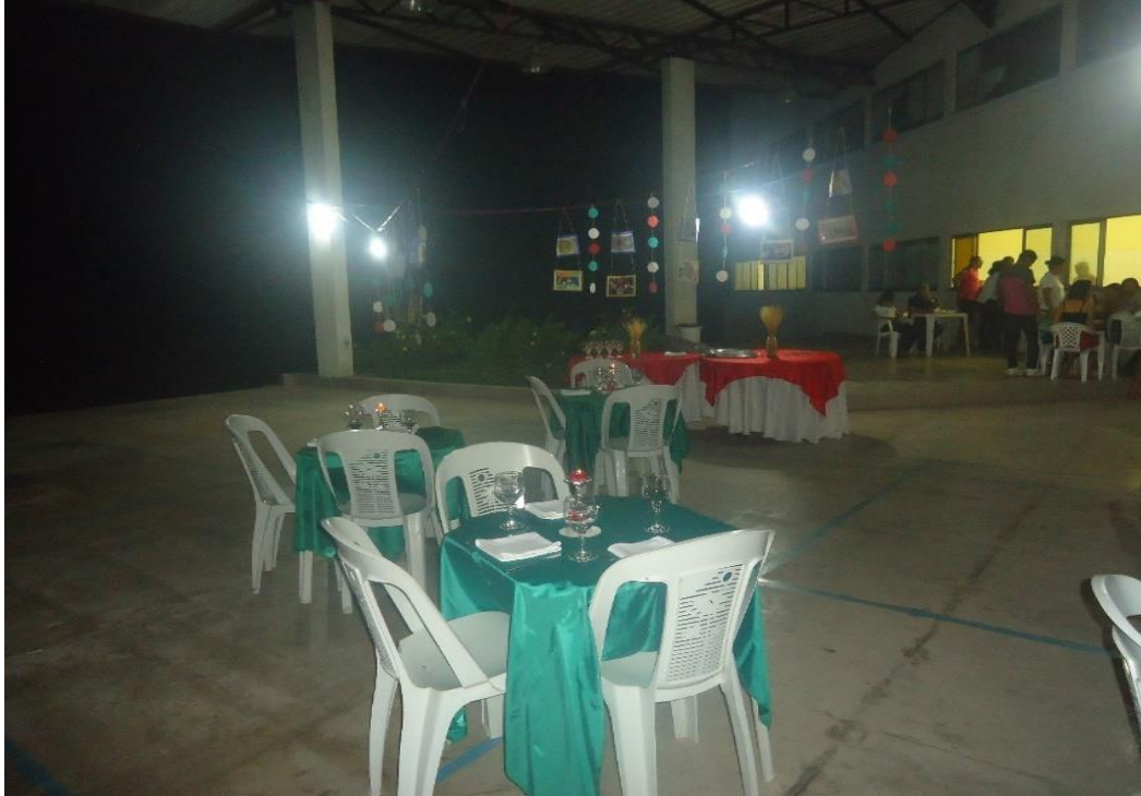
Figura 6: Visão noturna do espaço da realização do Banquete “Romeu e Julieta”

pequenas com toalhas nas cores da bandeira da Itália, assim como, flores e velas (Figura 6).