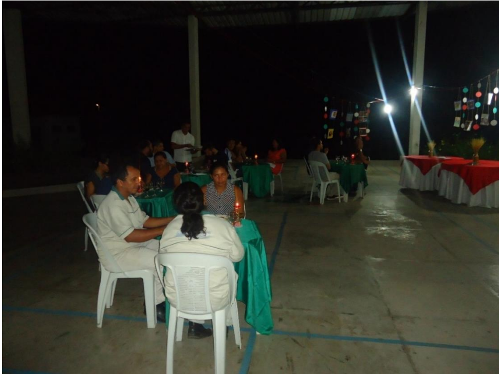
Figura 9: Convidados do Banquete “Romeu e Julieta”

central – lectus medius – e, à sua direita, o convidado de honra como ainda hoje é de praxe em nossas mesas. [...] Os outros comensais dispunham-se no leito da direita – lectus sumus – e no da esquerda – lectus imus ” (FRANCO, 2001, p. 45-46).