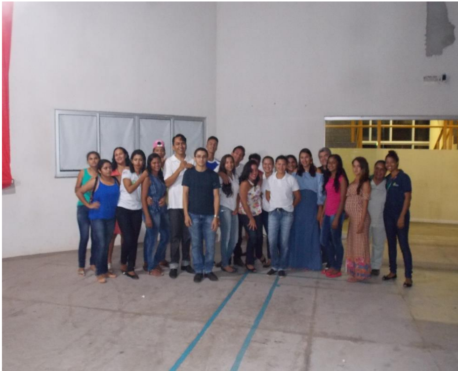
Figura 22: Alunos, Funcionários e Diretor Geral do Campus IFMA/Barreirinhas

Nessa perspectiva, em contato com distintas áreas do conhecimento, os alunos experimentaram novos espaços de aprendizagem, ampliaram os saberes e sabores na sua formação educativa, desmistificando o conceito de Arte como ferramenta de apoio para a aprendizagem de conteúdos disciplinares mais relevantes. O saber que se almejou foi além da percepção utilitária do mundo. Buscou-se elevar, em grau de importância, a experiência estética e a estesia, como elementos que dão sentido a aprendizagem de um ser humano em sua totalidade.