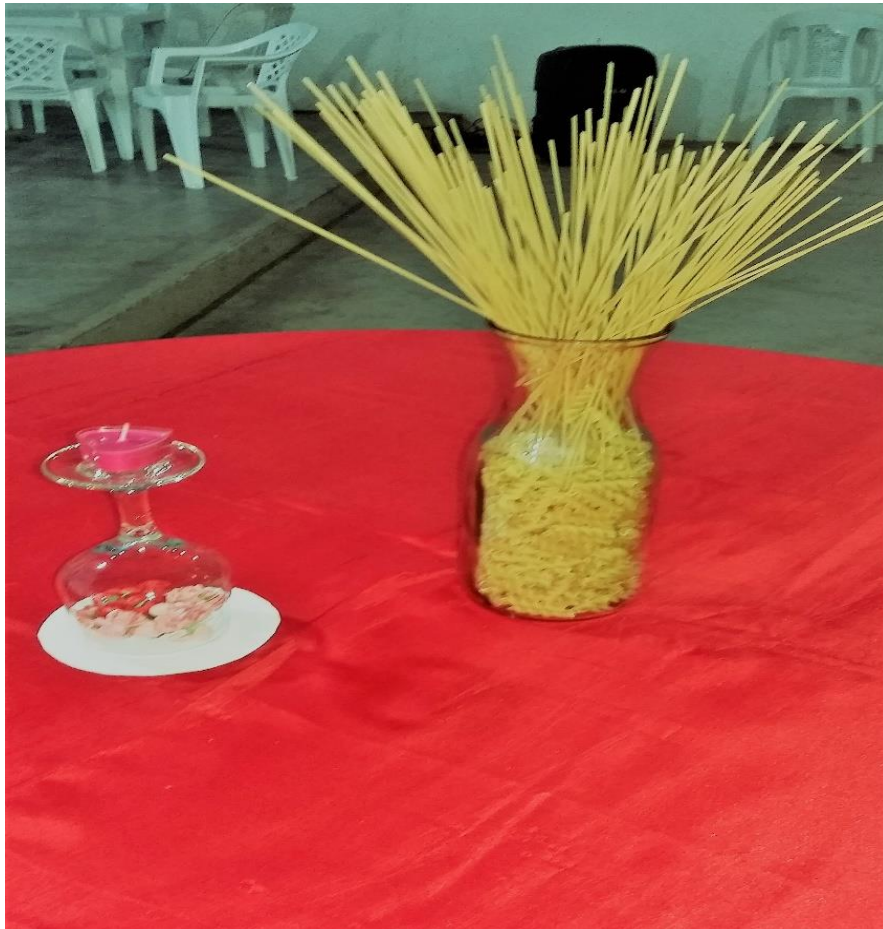
Figura 7: Decoração, em mesa lateral, do Banquete “Romeu e Julieta”

As fotografias utilizadas para compor o cenário e enaltecer o trabalho de composição criativa dos alunos, podem ser observadas com mais nitidez na Figura 8, que deixa à vista, os círculos coloridos nas cores da bandeira italiana, intercalando as fotografias, no perímetro em que as mesas estavam dispostas, e o local em que Julieta ficou posicionada, no primeiro andar, na janela destacada com a bandeira italiana e flores vermelhas, para trocar juras de amor com o personagem Romeu.