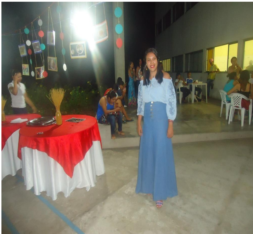
Figura 3: Aluna que interpretou a personagem Julieta

A personagem Julieta vestiu uma saia azul longa, blusa de mangas compridas e bordados nas laterais, numa tonalidade azul, mais claro que a saia, sandálias com altura média, também, com adornos azuis, brincos grandes e coloridos, cabelos negros, lisos e soltos, e uma maquiagem suave, como na imagem abaixo (Figura 3).