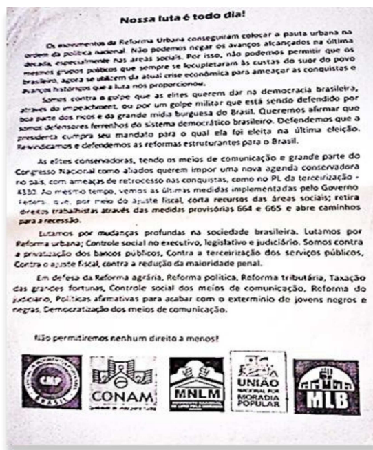
Ilustração 5 - Panfleto produzido pelos movimentos de moradia e veiculado em 2015 e parte de 2016 em panfletagens

para o Fundo de Habitação e Consolidação do Sistema Nacional de Habitação. A inclusão do segmento nas decisões pertinentes ao PMCMV Entidades e criação de política fundiária compuseram alguns dos objetos demandados 32 .