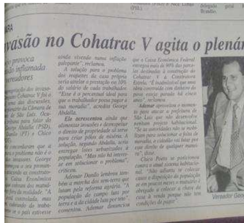
Ilustração 4 - Cobertura jornalística de debate na Câmara de Vereadores acerca das disputas no Residencial Cohatrac V.

O conjunto Habitacional Cohatrac V, localizado na região norte da Ilha de São Luís, era uma obra inacabada e foi irregularmente ocupado pela primeira vez em março de 1996. Diferentemente do Parque das Mangueiras, seus ocupantes eram, em sua maioria, militantes de partidos de esquerda e integrantes de ONGs; uma heterogeneidade que incluía aproximadamente 100 pessoas sob orientação do Fórum da Moradia. Após o primeiro despejo ocorrido em abril do mesmo ano, ele foi reocupado três vezes e em todas elas houve enfrentamentos diretos com a polícia e guardas contratados pela Construtora Estrela 17 . A notícia