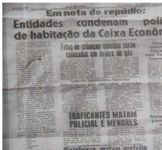
Ilustração 2 - Entidades lançam nota de afirmação às ocupações de imóveis urbanos e criticam órgãos estatais e construtoras