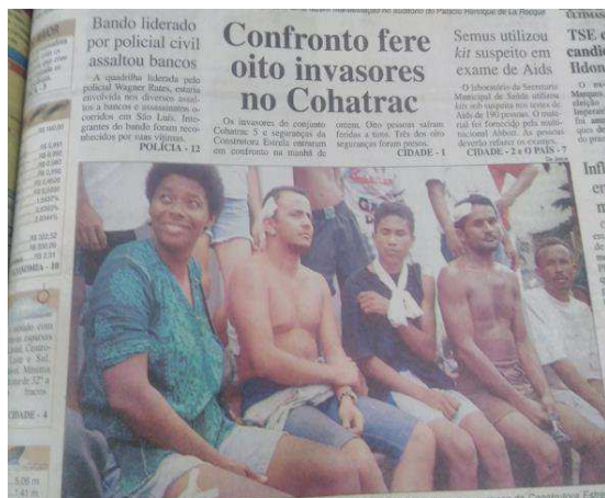
Ilustração 3 - Matéria jornalística sobre conflito entre ocupantes do Residencial Cohatrac V e segurança de construtora em São Luís.

cisões e lucros individuais e coletivos presentes posteriormente em suas trajetórias ativistas 16 . Os dois recortes de jornal abaixo dão ideia da amplificação, por parte da imprensa, dos conflitos que ocorreram no Cohatrac V e que colaboraram com a afirmação de um discurso legítimo acerca do “direito à moradia popular” e “reforma urbana” no Maranhão.