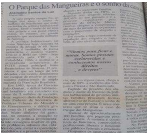
Ilustração 1 – Matéria jornalística em defesa de ocupação de residência escrita por sindicalista Fonte: jornal O Estado do Maranhão 25/05/1996