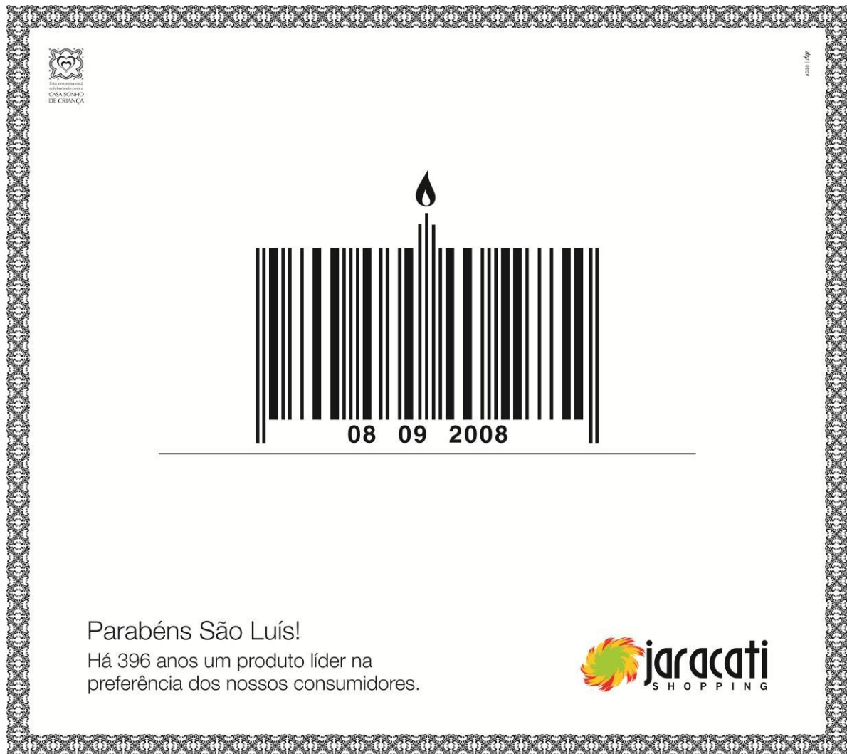
Figura 3 – Anúncio Aniversário de São Luís/2008