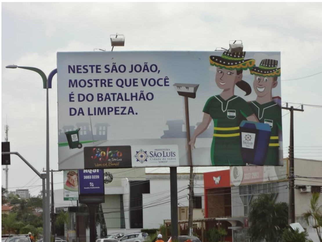
Fotografia 1 – Anúncio Festas Juninas/ 2011