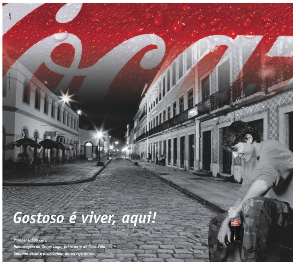
Figura 2 – Homenagem ao aniversário de São Luís