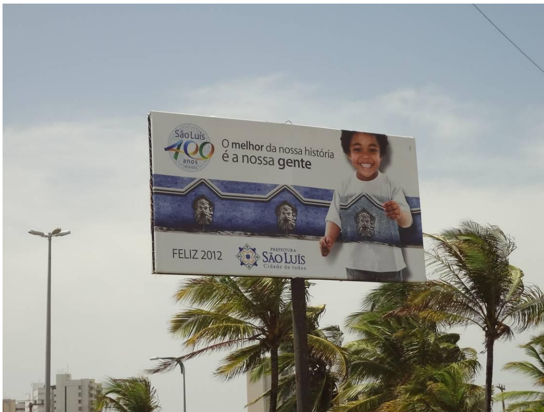
Fotografia 4 - Anúncios comemorativos dos 400 anos de São Luís