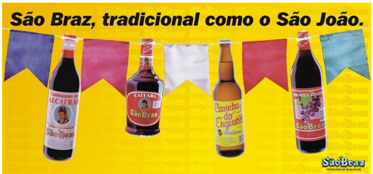
Figura 4 – Anúncio Festas Juninas/ 2000-2001