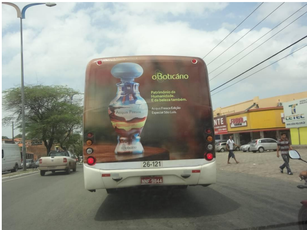
Fotografia 3 - Anúncios O Boticário