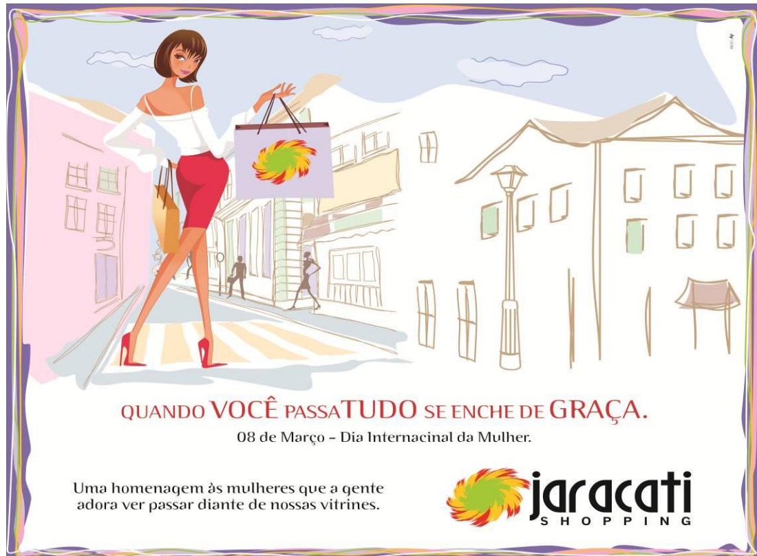
Figura 1 – Homenagem ao Dia Internacional da Mulher