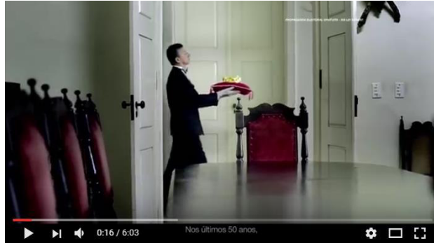
Figura 19: “Carta dos Maranhenses”. Fonte: DINO, 2014 (Youtube).

reuniões, dentro de uma casa antiga e luxuosa, que pode estar indicando o “Palácio dos Leões” 9 . O palácio aparece como um lugar com tons de impessoalidade, frio e sem vida.