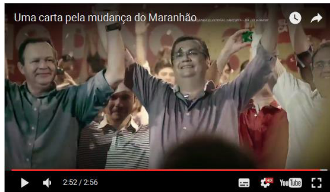
Figura 14: Flávio Dino emocionado. - Uma carta pela Mudança do Maranhão.

Os elementos composicionais da Carta aos Maranhenses nos fazem descrevê-la aqui, como afirmado anteriormente, ao gênero epistolar, ora aproximando-se das práticas das cartas da esfera privada, como uma “carta pessoal”, ora tomando elementos daquelas da esfera pública, como uma “carta aberta”.