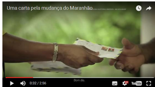
Figura 12: Mãos - Uma carta pela Mudança do Maranhão.

inserir o eleitor, e trazer a participação popular para a campanha, e, na sequência, vários trabalhadores rurais vão recebendo a carta e iniciando suas leituras.