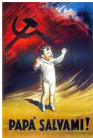
Figura 5 Cartaz italiano - “PAPA, SALVAMI!” Fonte: FARIA, 2006

Vejamos por exemplo, a intericonicidade 6 ou a memória estabelecida entre a charge de Cabalau e a imagem abaixo (Figura 5) que data de 1943 e tem referência atribuída a Mussolini. O cartaz foi produzido como parte de uma campanha para propagar o medo entre italianos: “com a ameaça de que as crianças podiam ser raptadas e levadas para a URSS. Um cartaz mostrava um bebê aflito, com o monstro terrível do comunismo por trás. ‘PAPA, SALVAMI!’” (FARIA, 2006, s/p).