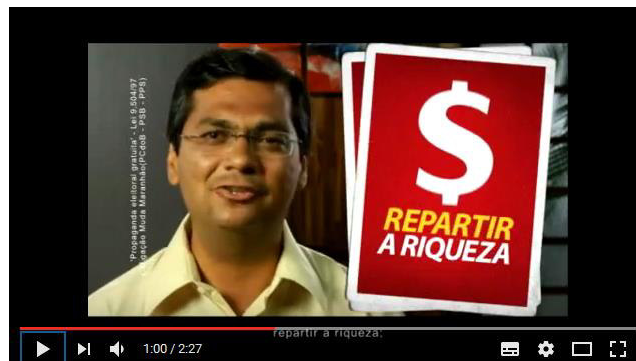
Figura 16: Campanha Flávio Dino 2010.

Em 2010, em um dos vídeos da campanha eleitoral, que data de 17 de setembro, o sujeito enunciativo é outro, e assim o seu discurso parte de outro lugar, enunciando o “repartir a riqueza” como uma das propostas do plano de governo (Figura 16).