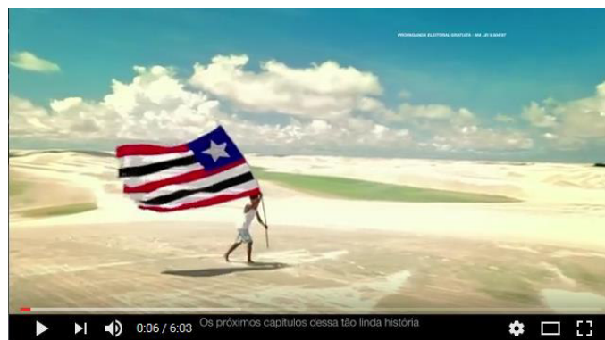
Figura 18: “Carta aos Maranhenses”.

O último vídeo que analisamos da propaganda eleitoral do candidato é intitulado Carta dos Maranhenses , veiculado na mídia (televisão e internet) em 1 de outubro de 2014. Este faz uma espécie de resumo da campanha e retomada do primeiro vídeo do candidato analisado no tópico anterior, é como um resumo do diálogo estabelecido entre o candidato e eleitores durante o período de sua propaganda eleitoral.