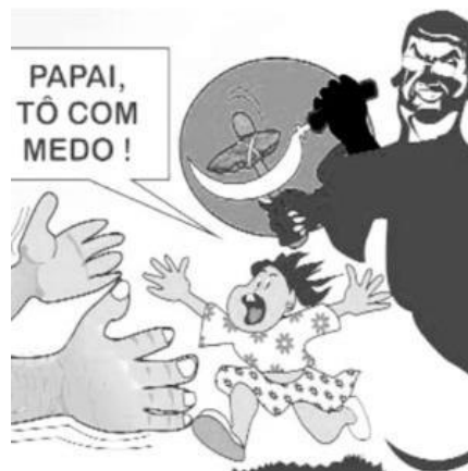
Figura 3: Charge Cabalau.

A charge (Figura 3) é de autoria do jornalista e chargista Clóvis Cabalau, e foi publicada no dia 10 de agosto de 2014, no jornal maranhense O Estado .