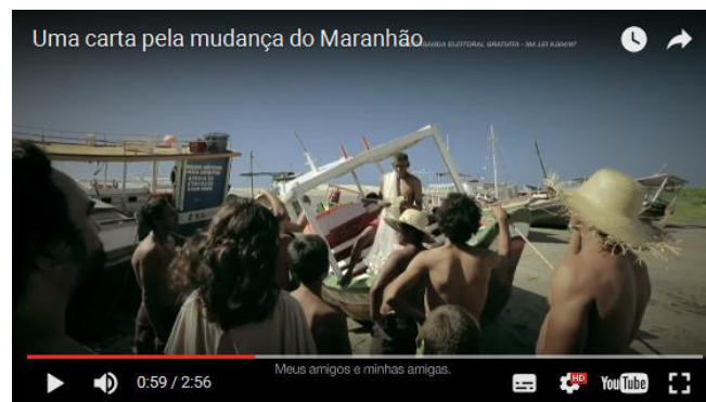
Figura 13: Pescador - Uma carta pela Mudança do Maranhão.

As leituras retratadas acontecem em grupos que aparecem em diferentes espaços: na mesa de jantar de uma família, à beira mar tendo um pescador (Figura 13) como leitor da carta, que lê como se estivesse em um palanque, imitando os tradicionais pronunciamentos políticos, e numa aldeia indígena, sendo lida por um dos índios na língua de seu povo. Essa inserção da figura indígena na propaganda estabelece um diálogo com o discurso da exaltação da diversidade cultural tanto linguística quanto social dos maranhenses e brasileiros.