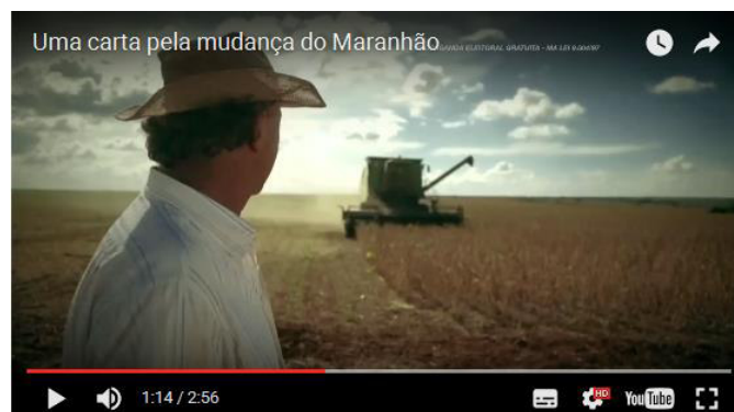
Figura 17: “Fazendeiro” - Uma carta pela Mudança do Maranhão.

Esse mesmo discurso faz-se presente na campanha de 2014, como podemos notar na sequência: “Vejo uma terra tão linda e tão rica. Mas vejo também que essa riqueza chega para poucos ”. O personagem que lê o trecho “[...] e tão rica”, não aparece em um grupo, ele é um dos poucos personagens que destoa dos outros de aparência mais humilde. É um senhor de cabelos grisalhos, branco, (Figura 17) que observa um dia de trabalho em uma grande propriedade de produção agrícola, enquanto lê a Carta aos maranhenses . Essa diferenciação visual entre os personagens desse vídeo é a parte não-verbal que vai ajudar a construir esse sentido de que existe uma desigualdade social que deve ser solucionada.