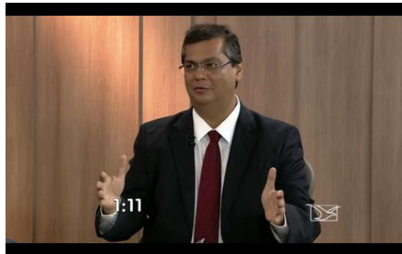
Figura 9: Entrevista: "eu sou candidato de nove partidos".

Procuramos perceber, através dessa primeira parte da análise, como o discurso é sempre atravessado e se constrói a partir de outros vários que estão dispersos e são retomados, transformados a partir de um domínio de memória.