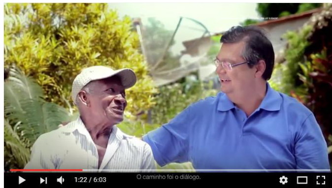
Figura 21: "O caminho foi o diálogo"

de Flávio Dino. Nos dois vídeos analisados, o candidato aparece nas cenas tanto quanto ou até menos vezes que os personagens que simbolizam o povo maranhense e quando aparece sempre está se colocando na posição de “parceiro”, ou até “redentor”, aquele que ouve o povo e age em prol deles. É o que percebemos no trecho “Mas como se libertar desses imperadores? O caminho foi o diálogo”, esse ponto marca a primeira aparição de Flávio Dino no vídeo.