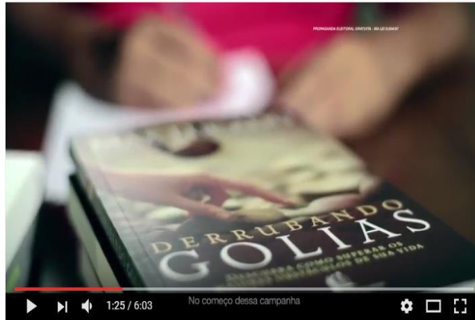
Figura 22: Livro "Derrubando Golias"

Derrubando Golias: descubra como superar os maiores obstáculos de sua vida é um livro de um pastor evangélico norte americano chamado Max Lucado. Em outro momento da campanha, um encontro do candidato com líderes evangélicos, Flávio Dino definiu esse “Golias do Maranhão” como o “quadro de pobreza, exclusão, negação de direitos básicos.” (COSTA, 2014). A prática de promover encontros com a comunidade cristã (evangélicos e católicos) não é novidade em campanhas políticas, mas na campanha de um candidato de um partido comunista que é enunciado por diversas vezes na mídia como pertencente a um grupo ateu, essas tentativas de estabelecer diálogos toma sentidos especiais. Por isso entendemos que no vídeo, a imagem do livro de um pastor evangélico não acontece por acaso, porque o diálogo entre “comunistas” e “cristãos”, no contexto sócio-histórico de produção do discurso político do candidato, ainda é um território de conflitos.