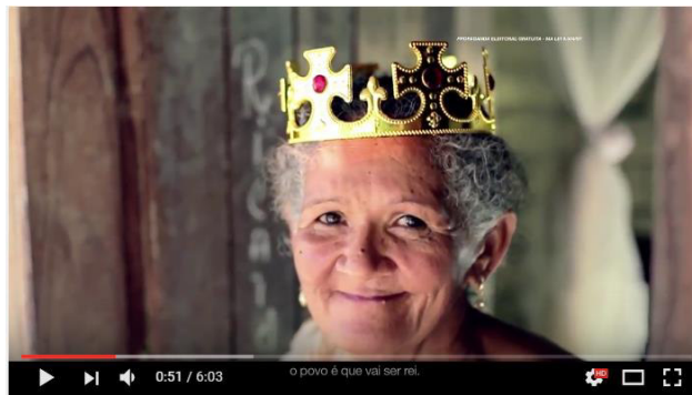
Figura 20: "O povo é que vai ser rei".

Em seguida, o personagem do “mordomo”, caminha em direção a uma luz ao final de um corredor e novamente há uma cena em close da coroa, dessa vez ela aparece bem iluminada e brilhante. A partir daí o personagem é mostrado saindo do palácio por uma porta frontal e vai caminhando em um bonito dia de sol, pelas ruas do centro histórico de São Luís, depois em vários outros lugares: caminhando em uma estrada, parado no meio da multidão de pessoas que caminham freneticamente na Rua Grande 10 e em o que parecem ser propriedades rurais, em meio a plantações. É em meio a uma dessas plantações que o “mordomo” começa a aparecer, coroando diversos outros personagens que vão aparecendo no vídeo. (Figura 20).