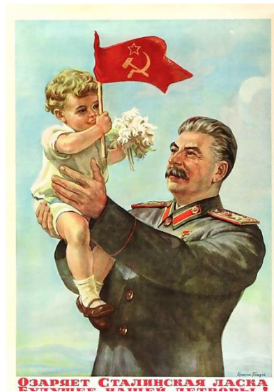
Figura 4: PROPAGANDA. Pôster de 1947 - O líder soviético Josef Stalin com uma criança ao colo, glorificando o "futuro radioso das crianças sob o comunismo." Fonte: FARIAS, 2006.

“desde o início pelos inimigos do socialismo marxista. Dois ou três anos depois da Revolução Russa, em fóruns anticomunistas nos EUA e noutros países já se tornara relativamente comum ouvir a ideia de que os comunistas comiam bebês.” (FARIA, 2006, s/p)