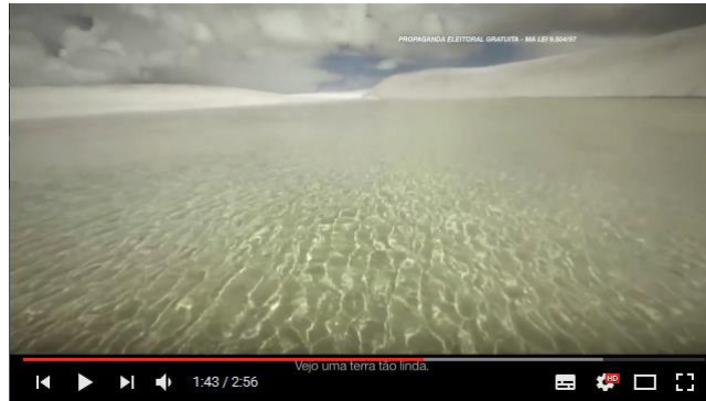
Figura 15: “Vejo uma terra tão linda”.

Vislumbramos neste mesmo trecho em seu conjunto com as imagens acima, uma interlocução com outra carta a qual a de Flávio Dino se liga, por meio de um domínio de memória: a famosa Carta do Achamento do Brasil , de Pero Vaz de Caminha.