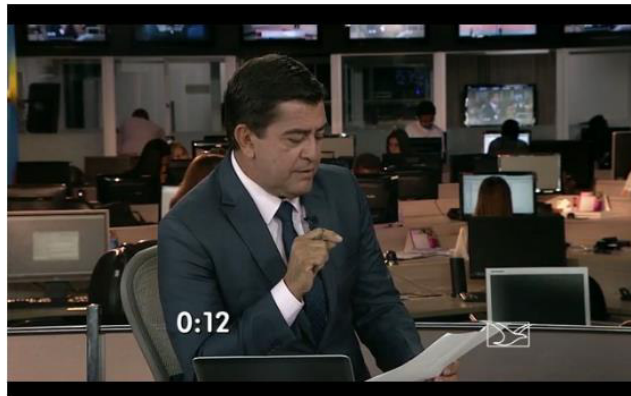
Figura 8: Entrevista: discurso direto.

junto aos dizeres cria um efeito de autenticidade das palavras. Esse discurso direto, como é enunciado em uma materialidade visual, no vídeo, não possui marcas de identificação como temos na escrita (aspas, dois pontos), mas pode ser percebido pela imagem do repórter segurando e apontando para um papel (Figura 8), à medida que fala, onde lê o trecho do estatuto como anotado por ele mesmo ( eu anotei ).