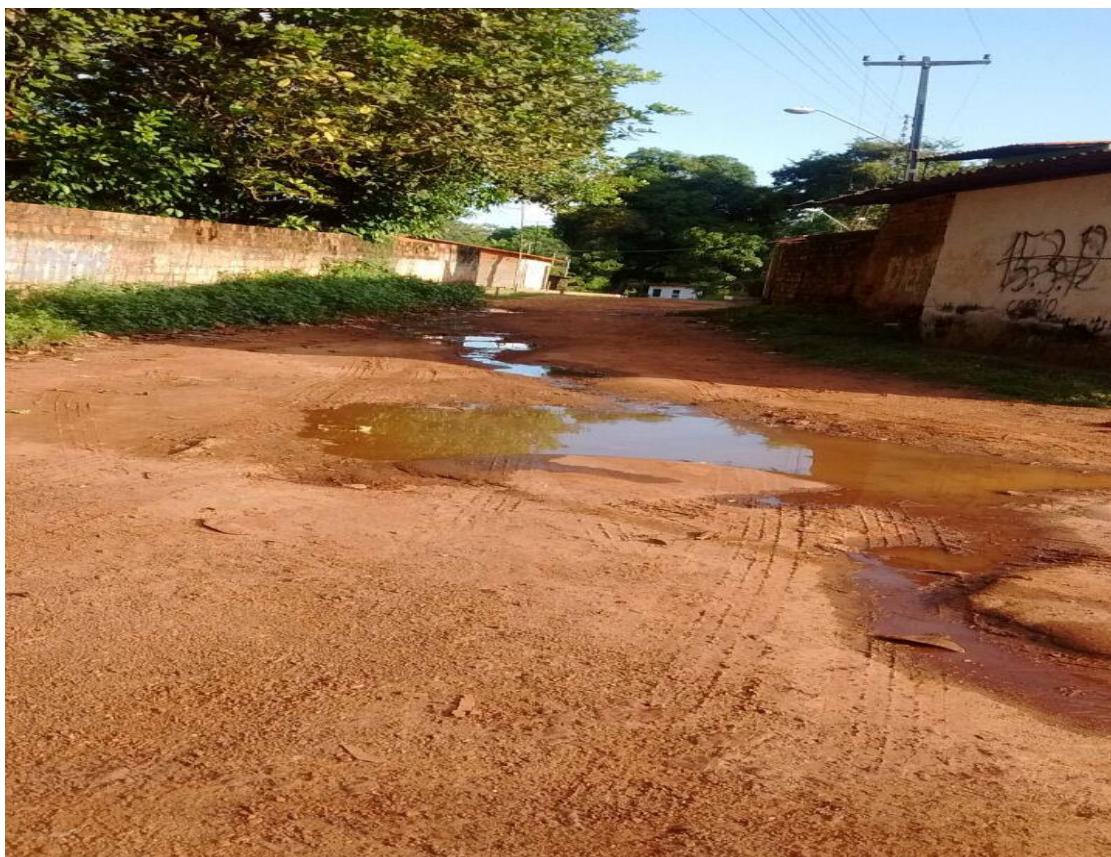
Figura 3- Rua do Bairro Quebra Pote.

As Figuras 3 e 4 caracterizam o ambiente de trabalho dos ACS investigados. Assim, as longas distâncias percorridas a pé são realizadas em ruas não pavimentadas, com acúmulo de água parada, com tráfego paralelo de motociclista e carros, exposição ao calor e sol. Todos esses fatores ambientais são relatados na literatura como prejudicial à saúde do trabalhador.