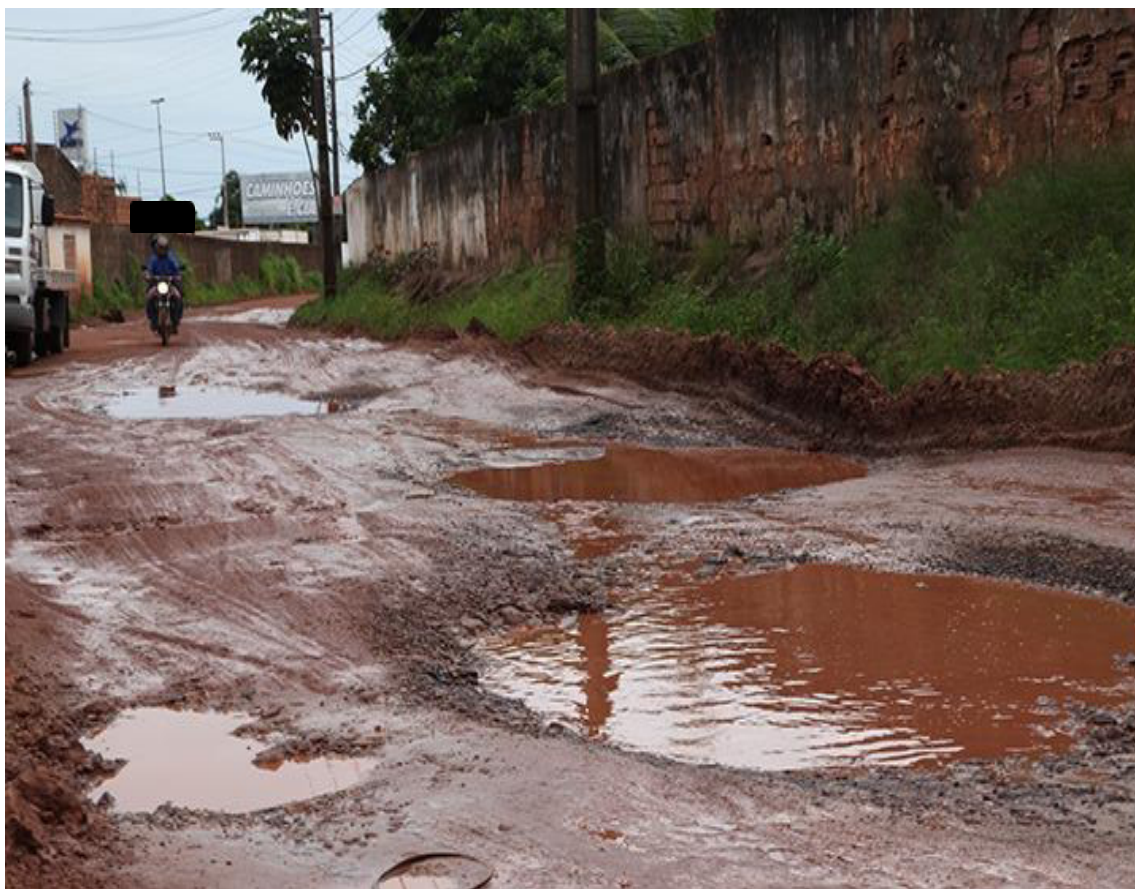
Figura 4- Entrada do bairro Tibiri situada no km 3 da BR 135.