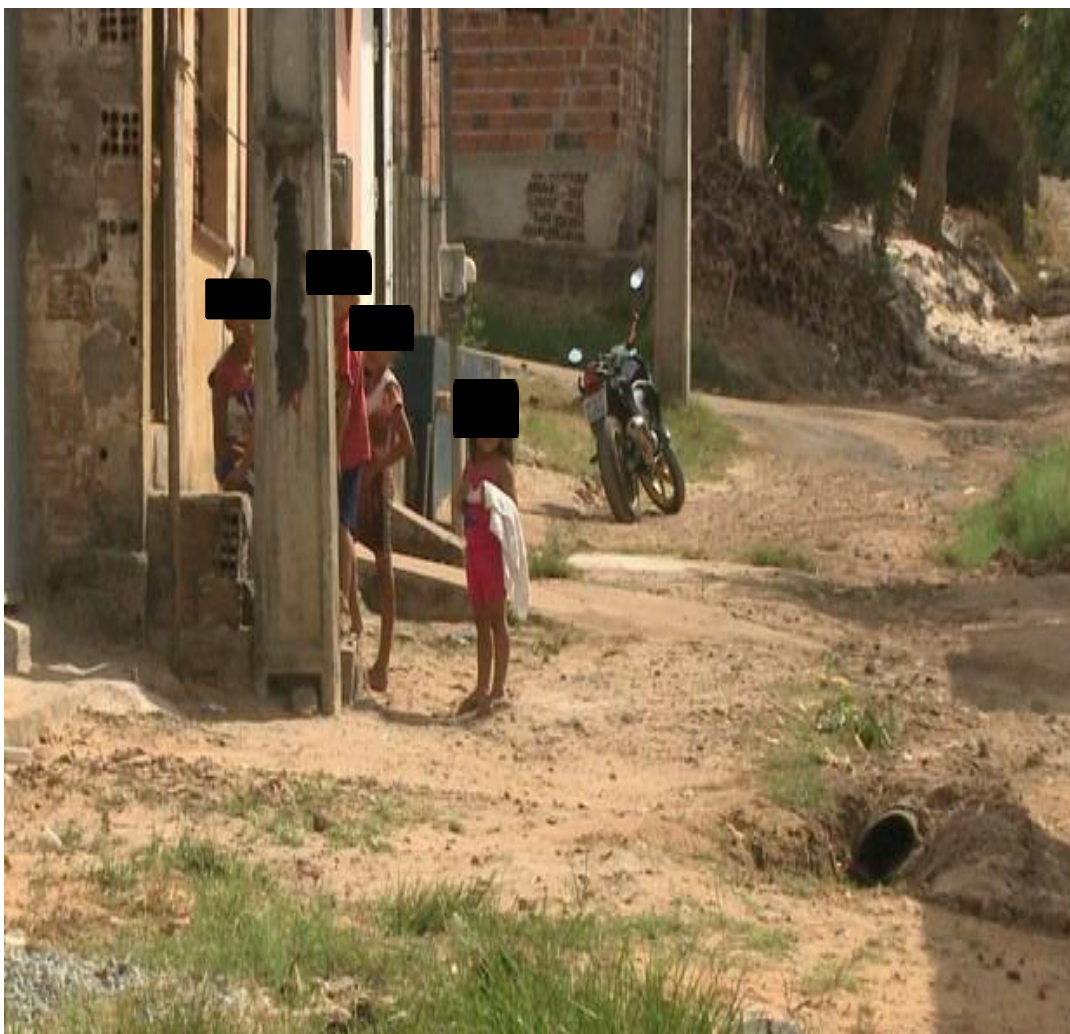
Figura 1- Vila Cruzado no Bairro Tibiri.