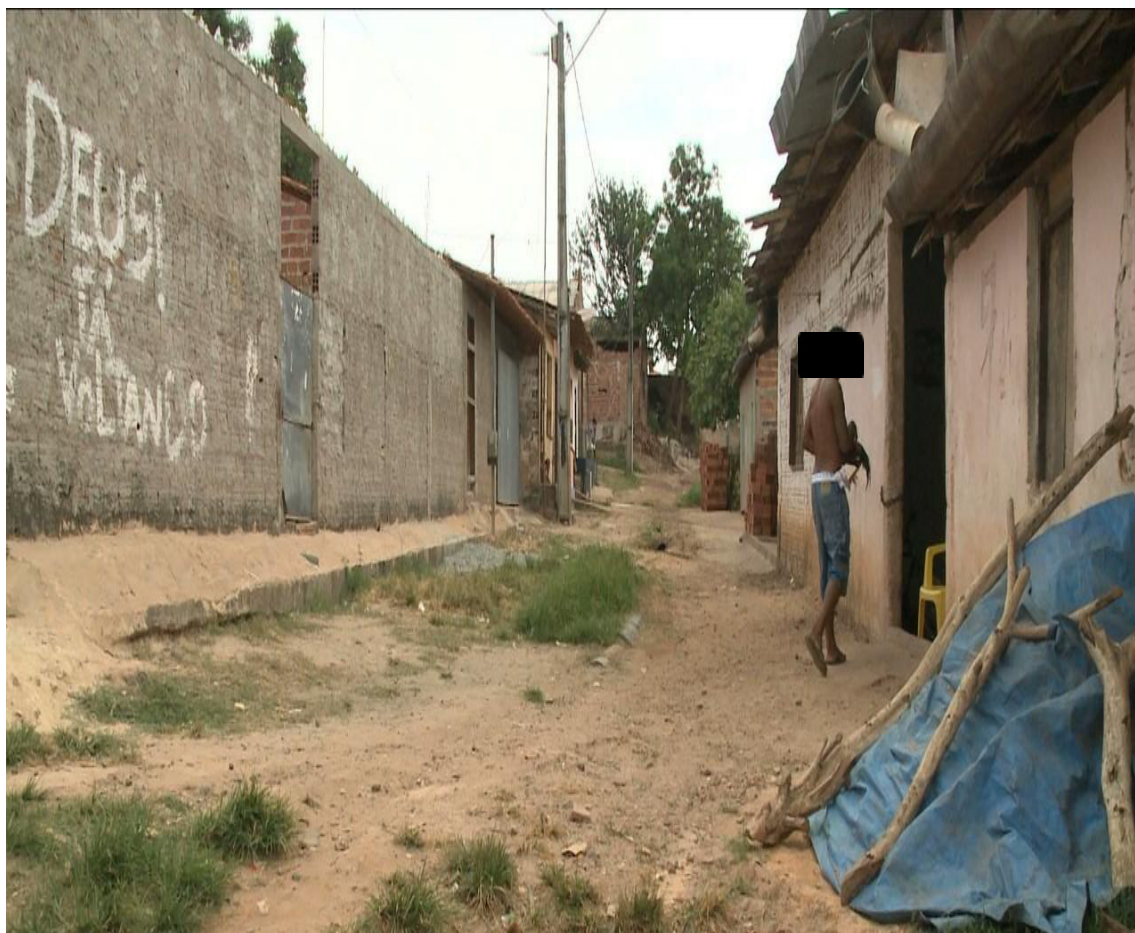
Figura 2- Vila Cruzado no Bairro Tibiri.