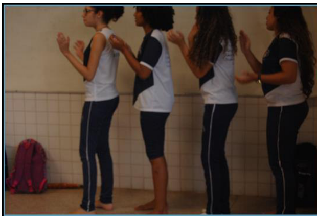
Imagem 7 – Elaboração de trecho rítmico