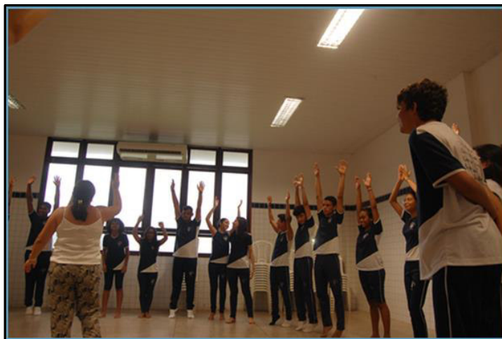
Imagem 4 – Parte do público da oficina durante uma das atividades

A elaboração da proposta (ver Apêndice 1 35 ) e a seleção do público-alvo levou em conta as características dessas turmas, previamente analisadas junto à coordenação, alguns professores e o próprio NAPNEE, e a disponibilidade dos horários para a realização da oficina, pois contávamos com a colaboração dos colegas professores dessas duas turmas para que as atividades acontecessem no período vespertino, quando os alunos estão regularmente na escola, nesta configuração de classe regular. Como as duas turmas ainda não haviam tido a disciplina Arte – linguagem artística música, o encontro deveria ser de fácil acesso aos alunos, a fim de que todos pudessem participar.