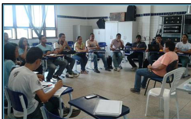
Imagem 1 – Reunião de formação em 2014

A imagem abaixo, mostra uma de nossas reuniões semanais, realizada no segundo semestre de 2014, onde tivemos a oportunidade de ouvir uma palestra com um dos técnicos do NAPENEE, com o tema: Educação inclusiva para pessoas cegas.