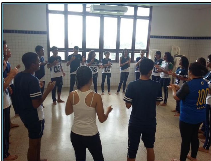
Imagem 8 – Roda de Imitação Rítmica