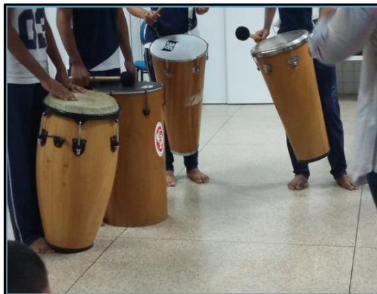
Imagem 11 – Inserção de instrumentos musicais