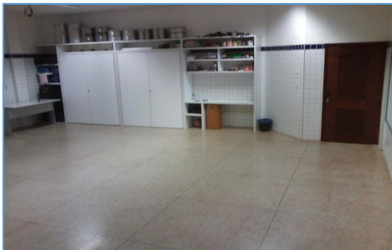
Imagem 3 – Sala de música em 2016