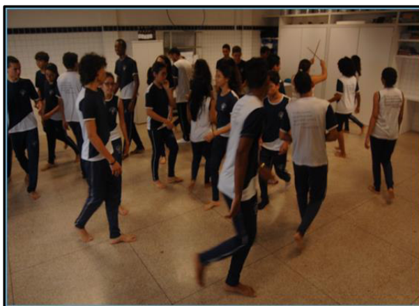
Imagem 5 – A caminhada