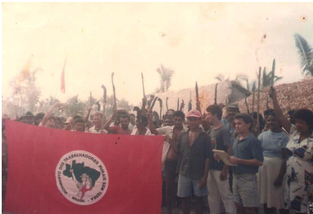
Figura 06 - A luta pela terra: Ocupação do Assentamento Marrecas.