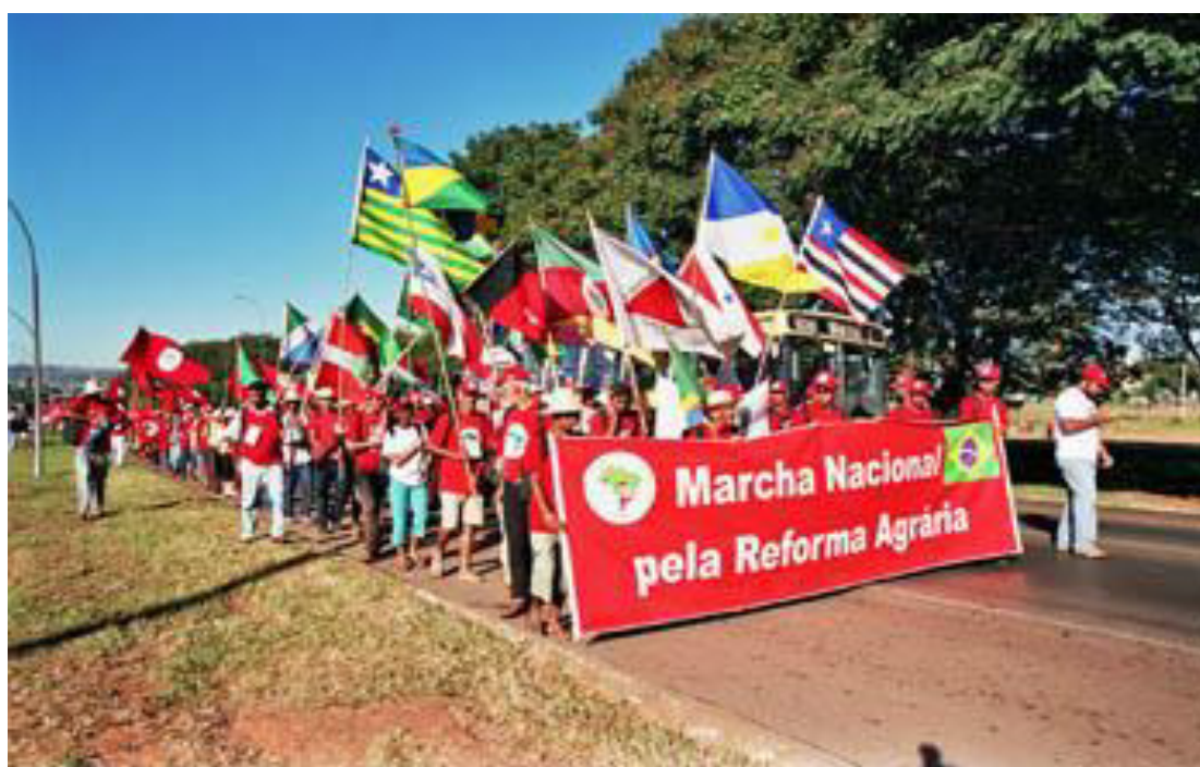
Figura 07 - Marcha Nacional pela Reforma Agrária. Delegação do Piauí participando da Marcha.