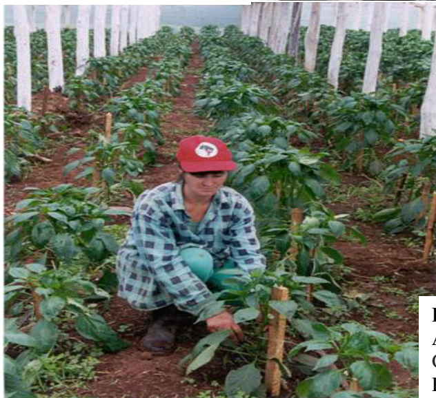
Figura 05 A concretização do sonho: Produzir... Cooperativa União - Dionísio Cerqueira - SC