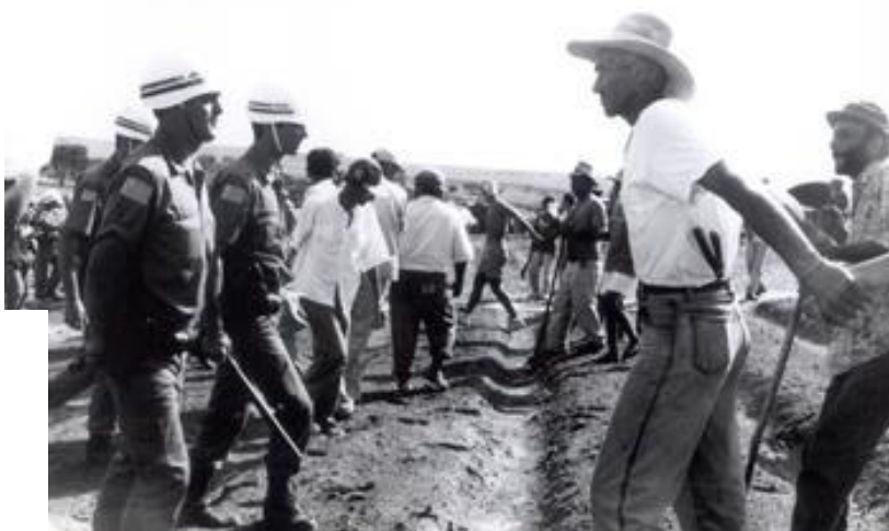
Figura 04 O segundo ato: Resistir! Despejo em Getulina – São Paulo - 1993.