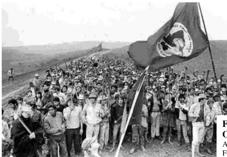
Figura 03 O primeiro passo: Ocupar A ocupação em Cruz Alta, em 1989.