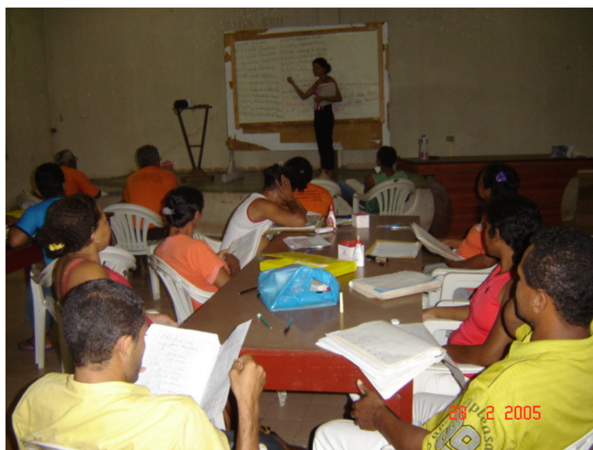
Foto 10: Professora com Alfabetizadoras e Alfabetizadores em Aulas de Escolarização no Centro Anajás, Imperatriz - MA.