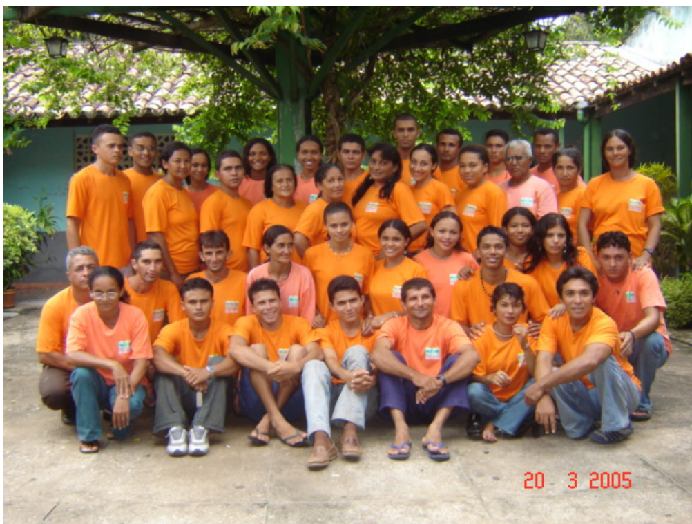
Foto 1- Alfabetizadoras e Alfabetizadores do Projeto EJA Tocantins