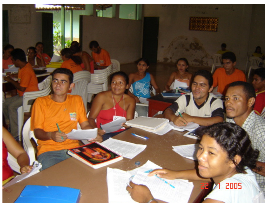
Foto 11: Alfabetizadoras e Alfabetizadores em Aula de Escolarização