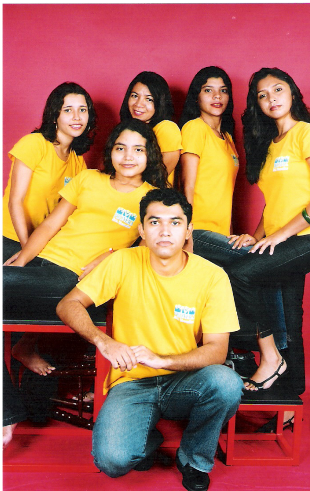
Foto 3: Equipe Pedagógica: Universitário e Universitárias da UFMA